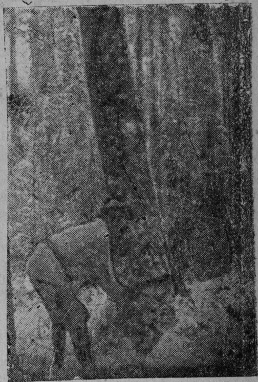
Новџкын Гөрд армџија нџма колхоз- нөј бригада вөрлеџө

Вылөжык өдџас пөрөдчөмын, но- нөшта вылө колө лептыны кыскөм- лыс өдџас. Тани тыр вермөм вөр- леџан фронт вылын.