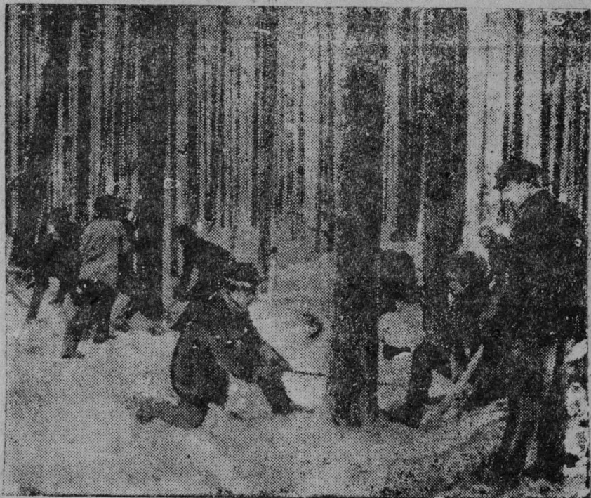
[ Трактористјас (Пөдделөөј базаны) суббөтүк ] ылым.