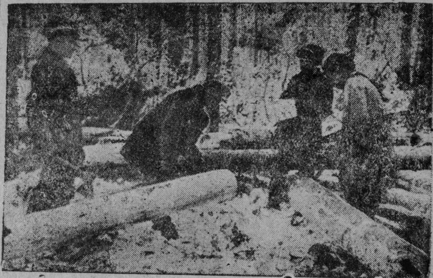
92 Кварталын звучыкјас здајтөны вөчөл кер.