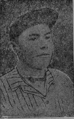
„14-öd Октабр“ - нима звучной бригадаы ударник-звучник—Вавилов В. J. (луннас вöчö 8-9 кмб).

нын та куца омёл. Конаев бригадалён. Высокосортной древесина куцта план сылаён тыртёма дас процент выло сөмын.