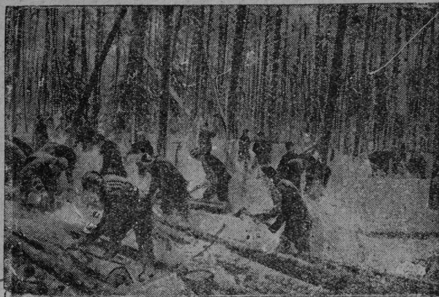
Ударнөј бригада уј вылын.

— Најө-өд аоныс абу чөлад,— чігарка гартыштг мөз чөвгөс Опои. Аслас чігаркасы скөрыс-лөлі, мыј-лө ез арты, щөри өрө кабалыс.—Ме ачым ујалаи лунсө вошти.