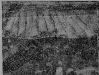
Пөдөдөльнөјса трактор базаын каөишчө