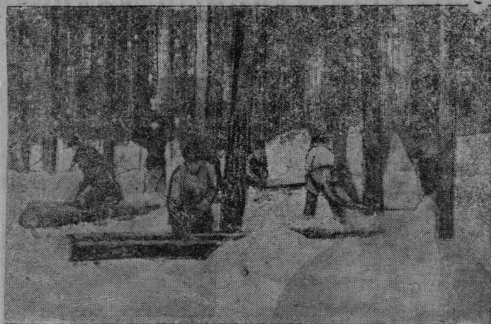
Шојнатыса ударној бригада

Ми миллиәннәи петам коәб, — Тәд-жә сижәс лутәј враг. Кодыр ковмас — өгә повзә — Косылы сөтам томоа кад.