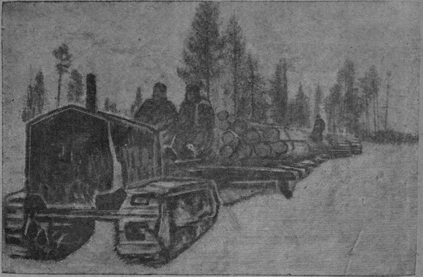
Гриваса трактор базаны тракторби кыскалбны кер