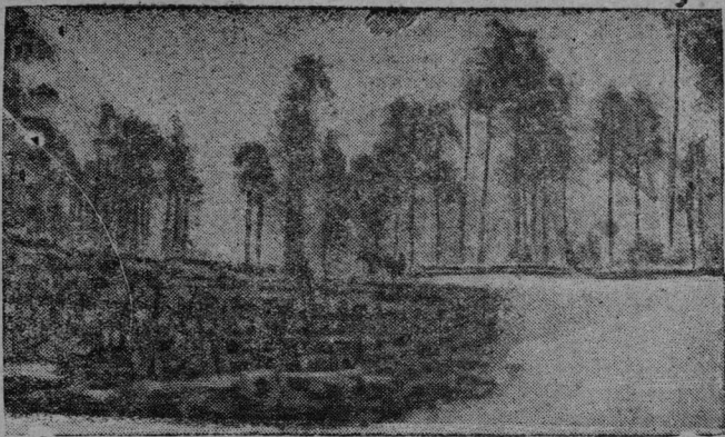
Гагторса „Красној Октабр“-нма сквоанөй звучнөй брігада кыскалө кер. Каждөй вөв кыскө 7-8 км. лун. Бура ужалдыс премірујтөма 450 шөјт дон.

Панферов выла ксөоны мыждөм јас эмпірізмө, код вылын пө суалд смылөн творческөй методис. Заводітн ны короны выл уколд. Лібедінскі јорт зөв төдчана гіжө: „...Літөра тураын ковмас нуны чорыд тыш эмпіріјаскөд“. („На литер. посту“, 27-бд № 1931 во). Мөдлаын: „Панферов жорт тьртө эмпірі ческөй озыр материалдн да оз гөгөрво сіјөс осмылі вајтан мөгсө, конкретностын ема јос противоречіјө сөз вөјөдөмсө“ („На литер. посту“, 28-бд №, 1931 во. Төдчө дөмыс міян). Некымын јортјас РАПП-ыо мөвпадын, мыј эмпірізм (оз тьрмы „пөлузучө“ кыв сөмын. секі ескө і Стөны олоөвмылас воіс) — медыжыд опасност. Тајдөм необек тывнөй критикаыс торја јортјасөс јөткө прөспектіва воштан туж выла, літө