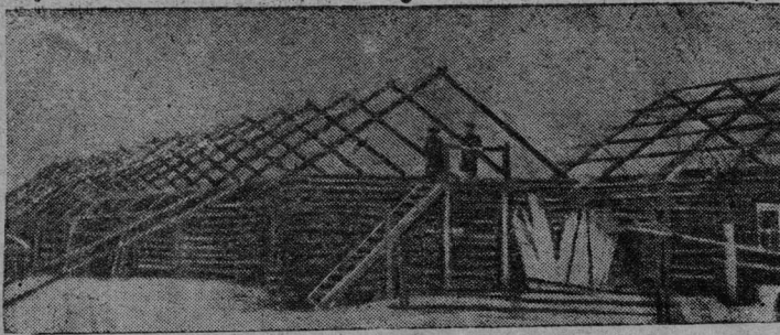
Візіна „Возрожденіе“ колхозлѳн скѳт візан карта.

Вѳдѳм-кѳ, Веров кыпѳдас асоыо котолоксѳ, медым боотны картупел, сѳмын сїѳ каднас Азарін лептїс жур-сѳ да адїс котолок пыѳѳї „вїжѳв вешество“.