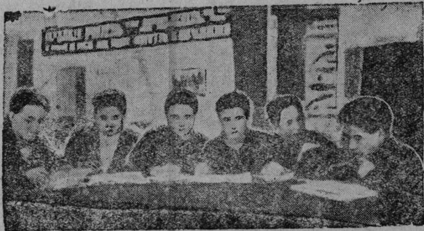
Педвуза студентяс бригадын велөдчоны