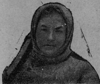
Вөрүжүвүсә звүчүңа — Квашина. Квашина аслас вербсыкбб феврал 1-бб лун кежлб кералбс 1600 кбм. да нбшта кбсбсбс вбчны 200 кбм. сартбб.