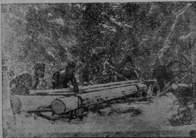
Чассэ „Выл Час“ колхозлөһи ударнөй бригада кыскалө кер.

Забөднөһи, талуна могјас оз вермыны бөкө колөһины пролетарскөй гижыөсөһи. Колө чорыда тышканы литературнөй халтуракөд. Ужалыс йөсө волнујтан вьл вөпросјас принципалнөй политическөй высота вы-