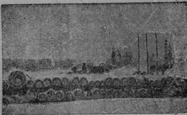
Ударнөй колхознөй бригада „Лозунг“ (Лөзымса ө/с) декабр 20-өд лун кежлө асыс вөркыскалан заданнө тьртис 30% вылө план сертэ

Тайө чуждөй влјаннөјасыс төдчөһи пролетарскэй литература колтчөһи. Бөрө колөмсө оз поҕ виставны куш өтү пролетарскэй гижыяс ичөт култураһи. Бөрө колөмөһи вывти ыжыд помка сийэ, мыҕ бмдоаи өикас буржуазнөй теоріяјас да теоріякајас абуна помөч бырөдөмө пролетарскэй литературасыи. Воронщинаөс, перевөрчөвшинаһи, лөфронтөс пазөдөһи—ыжыд воокөв бөрө колөмыс петөм ку-