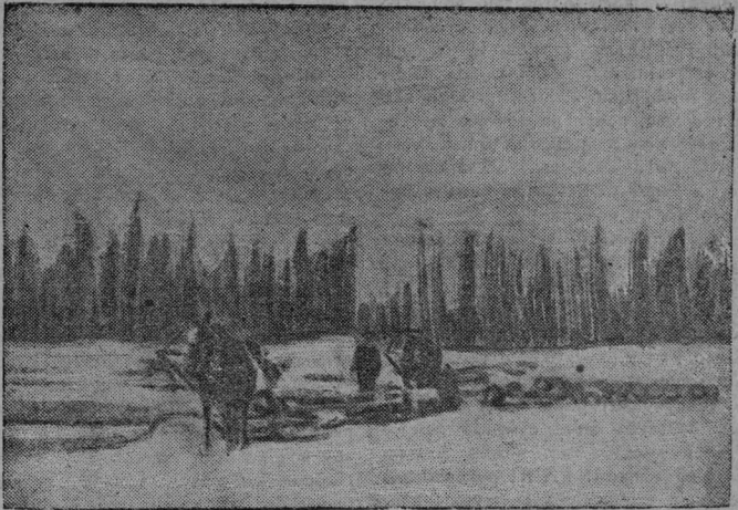
Часса тракторнэј базын Русановін ударнэј брїгада улэ катїшїщэ кыскалэ кер. Быд брїгаднїк ёні лунён кыскэ 6 км. сјас.

Невыжд наповосткэј группавыс пролетарскай гіжыясалён ассоціаціја пёрїс массёвёј організаціјаб. Ударнїкјассэ літэратураб кыскём пет-