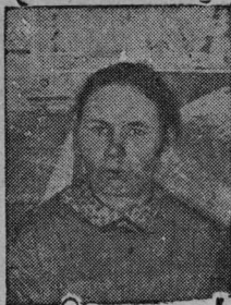
„Коммуна југбр“ колхозса мбслбзб ударница Омелина, быд лун амбтб 24 мбс.