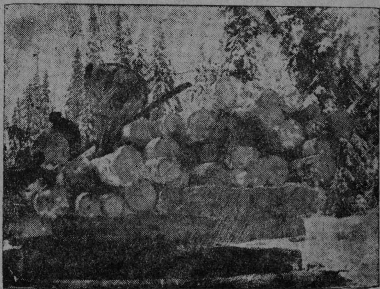
Размыслов јортлөн ударнөј бригада сөвтө трактор дод. (Часса база).