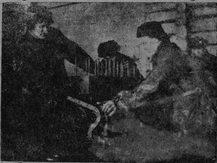
Час тракторнōй базын Лыјуров јартлōн бригада ремонтїрујтō трактор.