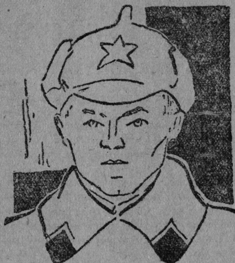
ПЫГЫН — Красноармејец-ударник.