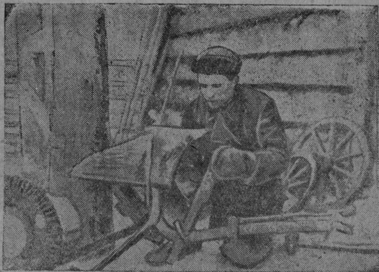
Көзә кезлә чөнтаһны плугјас.

татчө социализм понда тышкаоны өзјөдана көс- јысөмсө. Сесаң ваисны героическөј ужаланоам.