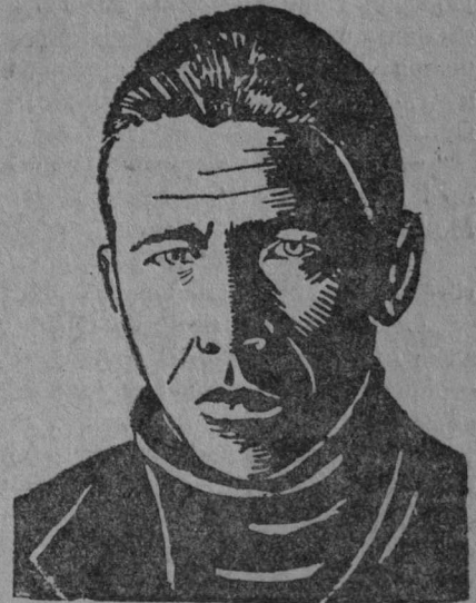
Истомин О. Ј. „Гөрд Ухта“ кол- хозыс (Ухта с. сов.).