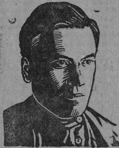
Улашов јорт ударнік „Вөрфронт“ колхозыс (Куломдін р-н.).

— Но сізөң-кө, вајө сөсоа варөвітнм... делө јывоыс мыј шуасны кыскаоыөјас?... мыјкө тај ті качатчыны кутінны... ојјаснад?