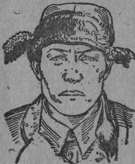
Казаков Св. Ол. (Көрткерөс с-сов.) вневөј-сковик, ужалө подвозка вылын, лунса норма тыртө 150% (Ви́абөж 44 кв.)

— Мыјнө те ојзан, мыј лоин? — јуалө сылыс буккурунөј бригадоөс палаззаса селсөветөан коллодыс делшер Лыјуров јорт.