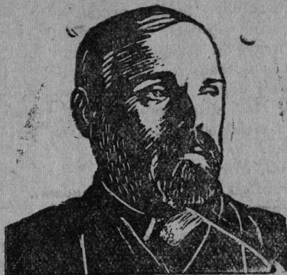
Чууев ударник-колхозчыкјас өлөтвывса дөлегат