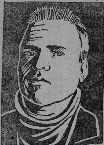
Расов жорт. Слоттүлгөсө делегат.

лдог, жоо кыялас: „Колхозчык-жасос кантөг та- во коласны... наросто... вылысань шөктөма- бо.... Сыл-і сөтисны көйдиссө... Оңо Ива- ныд синаждөн выло мунис... Оз-і лок сеса“.