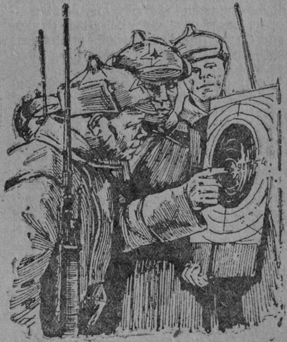
Стрелковөј закатвөјас вылын.

Мед жургас драматургіја! Мед јіркөс лірика!