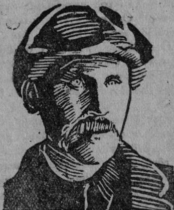
Колхозчык-ударникјас Слотвывса дөлегат Көчәјінов јорт