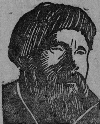
Пыстін Јермолај Ондреј. Слот- вывса дөлегат „Сөд Ылыч“ кол- хозы (Троїцко Печерскө) рајон.