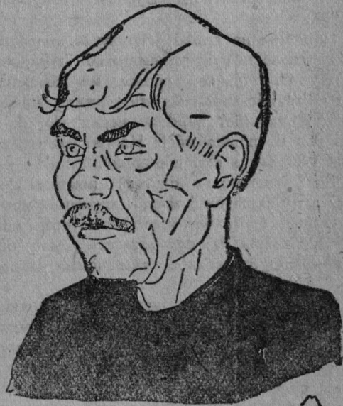
Ударнїк Нарпенбв јбрт Тараканбв нїма брігаданы вбр пбрбдбмын бура ужалбмыс прекїрујтбма 200 шїјїбн (Палачча).