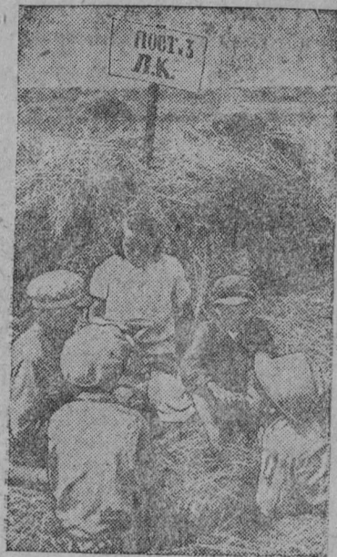
Քոյրէյա տրօյայ վիտն քօտ

Տէն կօլխօ, Տան կօլխօ,— Քսէ էտւ ու. Տւոյն վաճն Կու, տարնիկ, Յօյլոյն կտն կու.