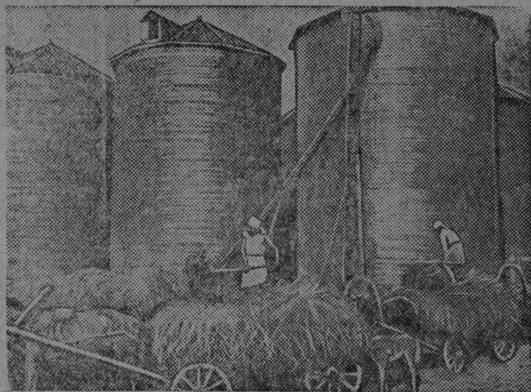
Şerpaş vɁlyɁn: Şilos vaşnajas