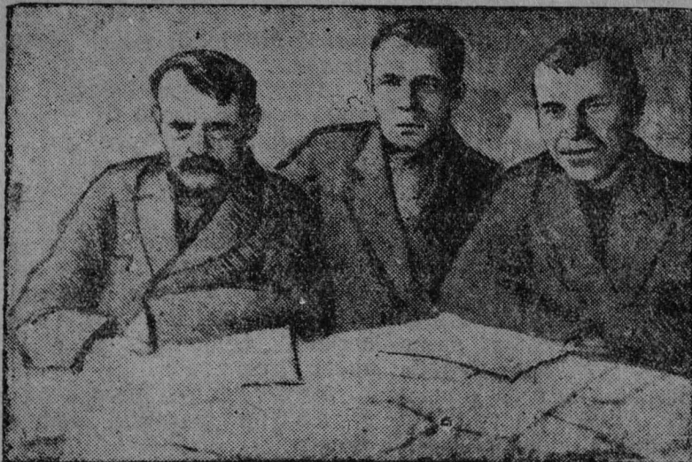
Տիմա Վեն, Յուջլ Դա Ռօճինսա Վիտոր,