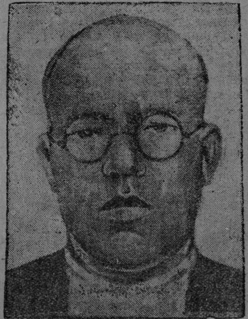
OIK-са jurалыс I. G. Коjuseв jort.

— Писателjasлэн мог — кьрэднь ассьньс талантсэ да сэмлунсэ кэзэjствен-