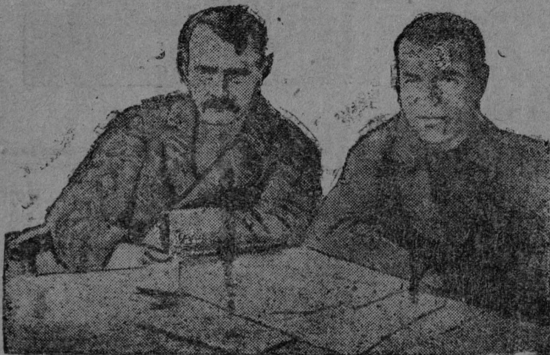
Tima Ven da Nəvdinsa Vittor.

■ R̄yt poməşis jubilarjas materjal v̄l̄n ləşədəm ız̄d literaturno-xudozestvenəj jukədən.