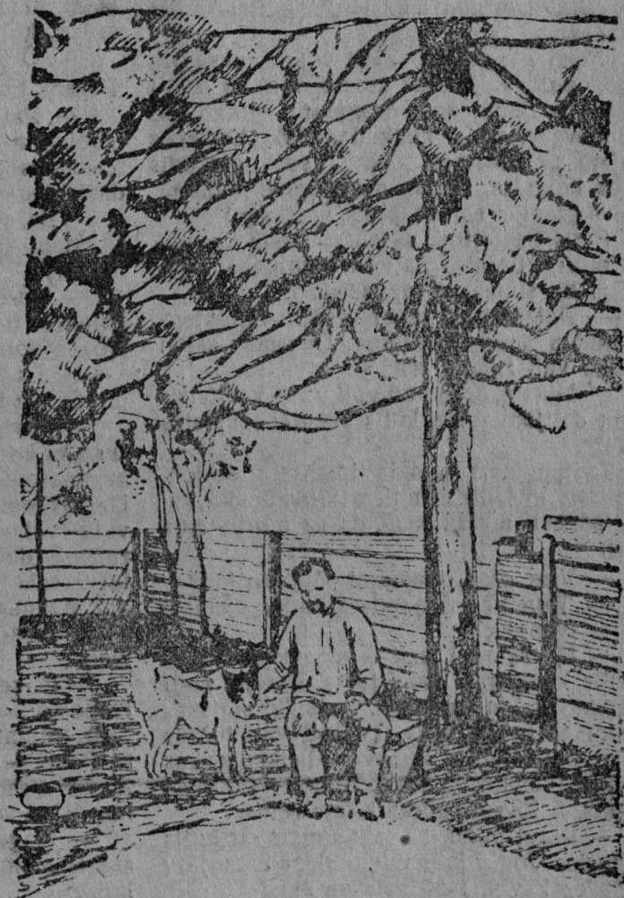
TI MA VEŅ askĀd ĕĕĕja niĕa pu ulĕn „Vojĕvĕn” ropĕjskĀd.

Neĕĕd, normaņa ſĀlĀm vĕrzĀdĀs... | Sizi morĀsad stavĕs ſukĀmas, | MĕjĀn paſĕjſtan—vĀlĭſti liĕmĕnĀs. Kĕvzĕst, lĕdĕbĕſĀj, ſĕskĕd kĀrjassĀ: Avu prĕſta ſiz naĕĀs lĀdĀma,— SetĕĀ puktĀma—mĕj mĕddonĀs.