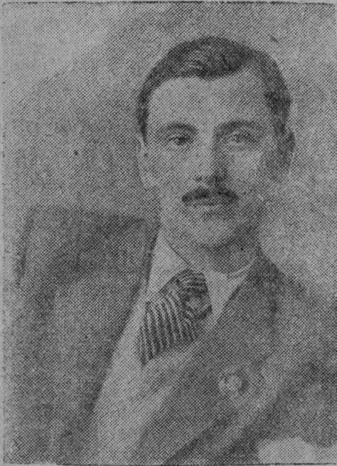
Куратовской юбилейной пленум вылын участник, поэт-орденоносец Сергей Михалков (Москва).

славной представительяс непобедимой Рабоче-Крестьянской Красной Армия радьясын тышкасьоны финской трудовой народ шуд всна, свобода всна. ( Аплодисментъяс ).