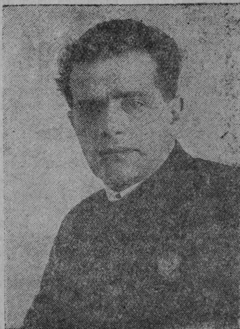
Куратовскӧй юбилейнӧй пленум вылын участник, СССР-са ССП Президиумлӧн член, писатель-орденоносец Ф. Панферов.

Сӧмын Сӧветскӧй Союзья, кӧні бырӧдӧма мортӧн мортӧс эксплуатируйтӧм, йӧзсӧ мездӧма быдсикас рабствоысь, Ленинлӧн-Сталинлӧн партия веськӧдлӧм улын вермӧ лоны збыльвылӧ возрождениеыс важӧн увтыртлӧм народъяслӧн. Сӧмын сӧветскӧй народ, кодӧн веськӧдлӧ великӧй Сталин, вермӧ свободнӧя