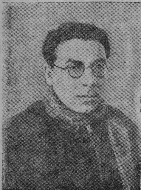
Куратовской юбилейной пленум вылын участник, СССР-са ССП Президиумлөн член, поэт-орденоносец И. Сельвинский.

ны самодержавиекөд да капитализмкөд. Ме сёрнита торъя йёз йылысь, өтка мортъяс йылысь, кодъяс ыджыд идея вёсна дасёбсь подвиг вылө.