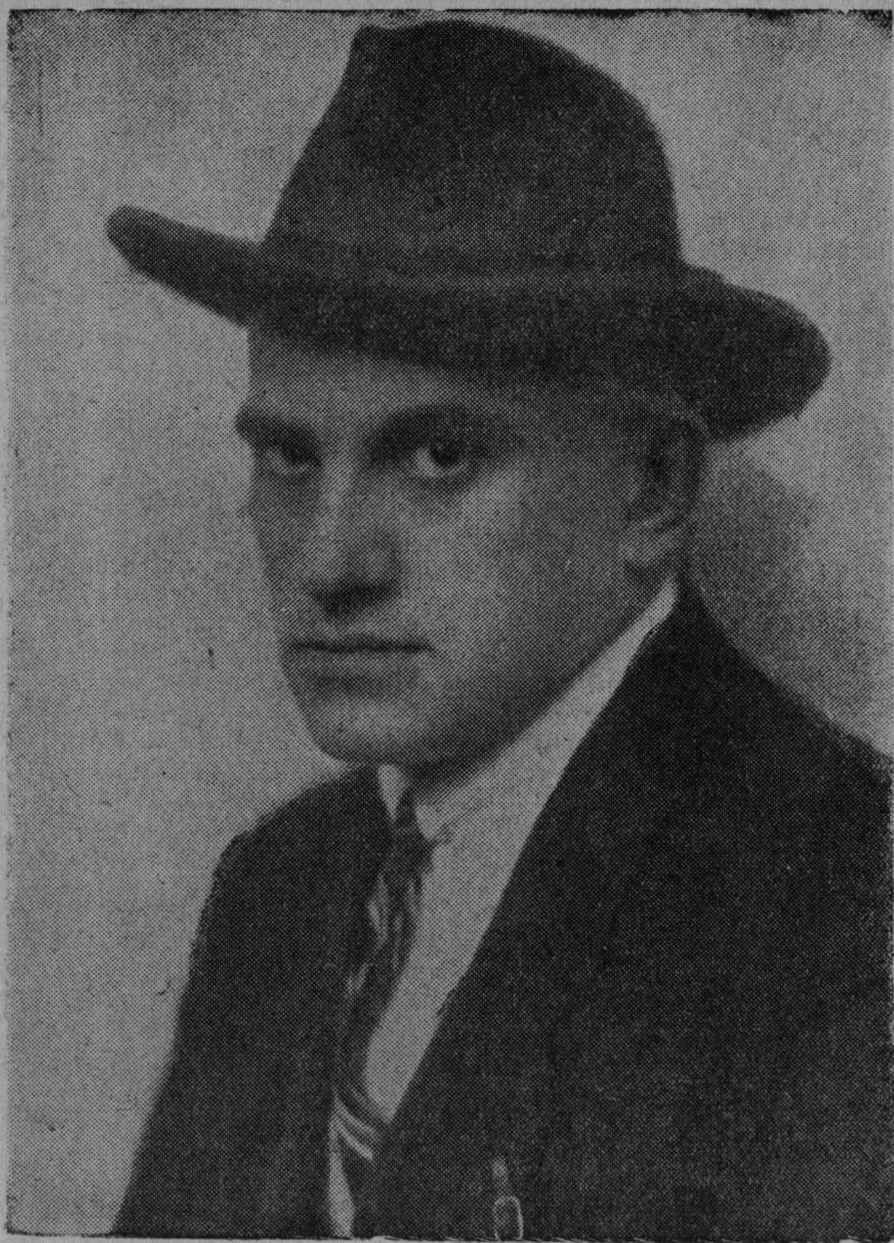
В. В. МАЯКОВСКИЙ (1930—1940)

щой лицоыс ачыс поэт; „Облако в штанах“, „Флейта-позвоночник“, „Война и мир“, „Морт“ поэмаясын вьсьталѳма сэтшѳм мѳвп, мый торья быд мортлѳн личнѳй шудыс кутас лоны поэянаѳн сѳмын сѳки, кор капитализмѳн увтыртѳм миллионьяс лыда йѳз бырѳдасны тайѳ гнѳтсѳ да заводитасны овны прамѳй, морт олѳ-