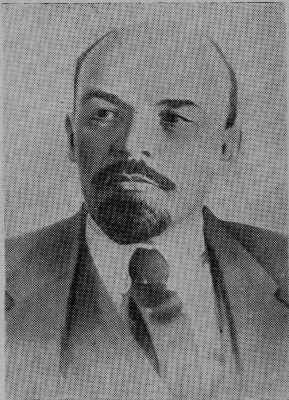
Владимир Ильич Ленин (1870—1940)