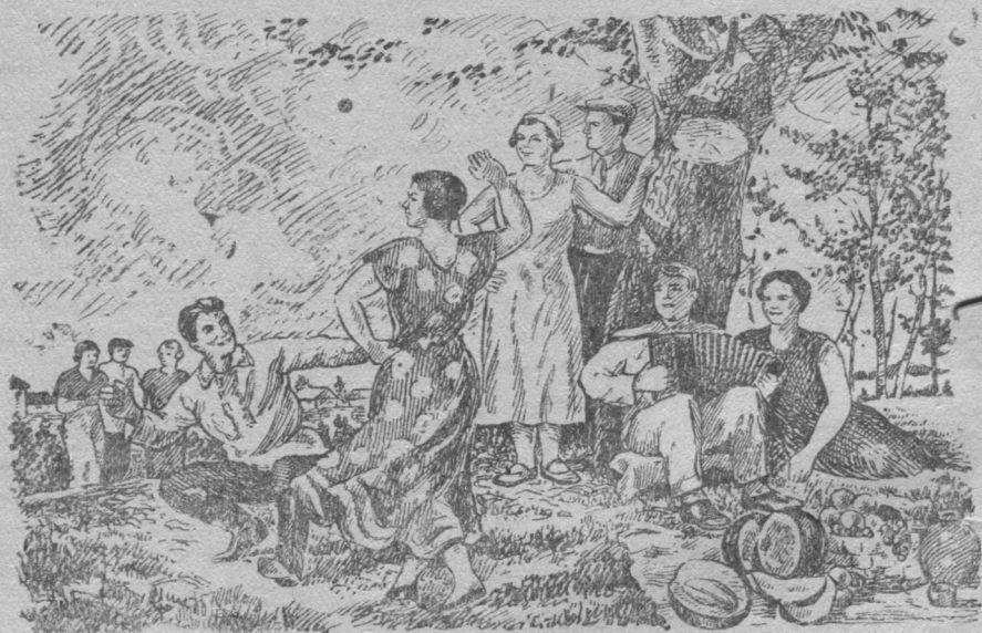
Выходной лунб. Мальцева картина выльсь.

Парма шбрын пуяс кузьбсь, Уна шедб мича кер. Уджалам ми ставным зїля, Оз трок уджсб лым ни зэр.