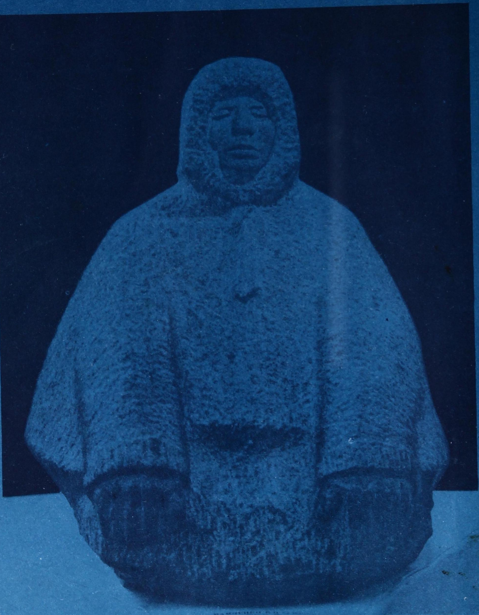
В. Мамченко. ТУНДРАСА КОРОЛЬ (гранит).