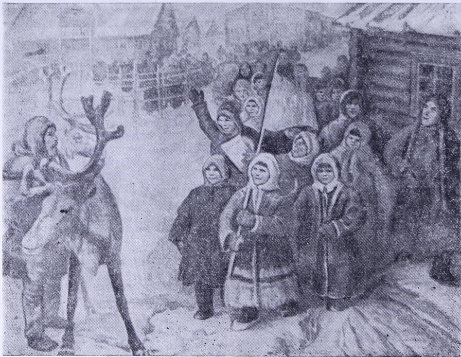
«МАЙ 1 ЛУН КОЛВА СИКТЫН» ҚАРТИНА.

ковскй галереяб. Ф. А. Модоров гижис и вель уна портретьяс, на лыдыс откымыньясөс позьб аддыны и мян краеведчөскй музейсыс—«Катя Валейскаялөн — Ижма сиктса делегаткалөн портрет», «Батраклөн портрет», «Школа-са учитель И. Юркин» да мукөд. Мянн краеведчөскй музейб веськалис и «Ненецкй волисполком» картина. Татшөм жб нима картина бшалб и СССР-са Революциялөн государственнй музейын — куйм мужичбй пу-