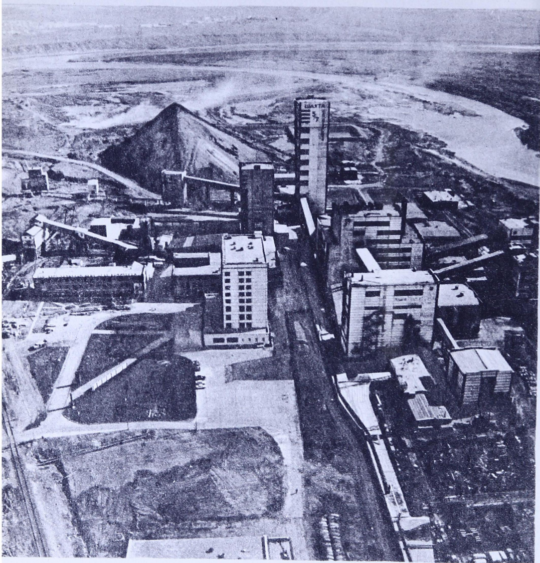
Воркутаьсь «Северная» шахта.