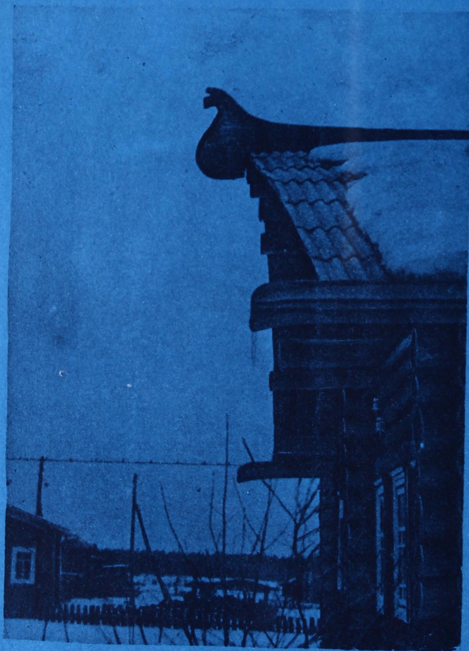
Кужӧны мичмӧдны керкаяснысӧ. Удораысь Пучкомаса олысьяс.