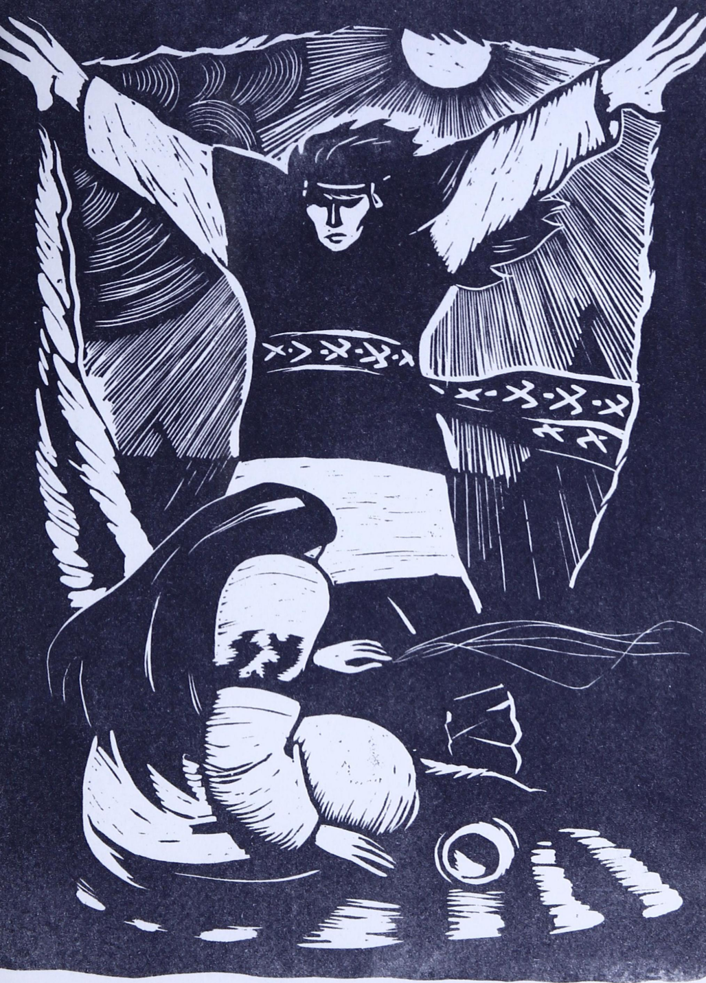
Коми фольклорысь. Кудым-Ош да Хосте.