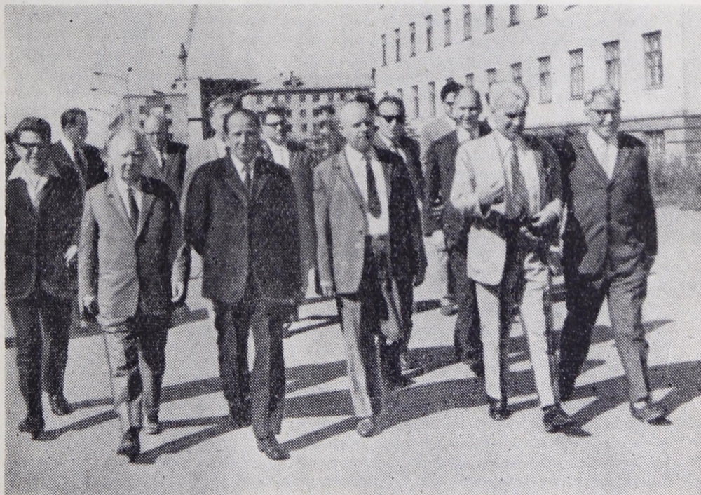
1972 воын Коми филиалõ волис СССР-са наукаяс Академиялõн президент М. В. Келдыш.