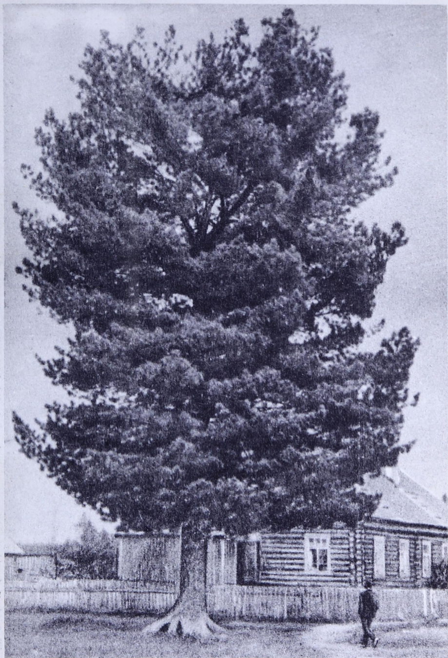
Сус пу — пармалён мичлун.