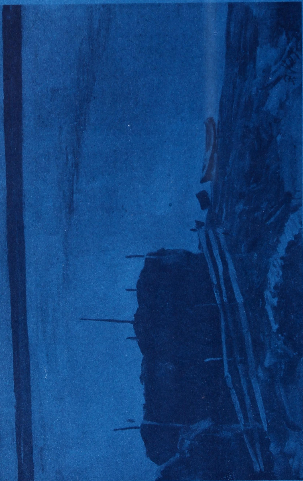
Рисуйтис Э. Коэлов.