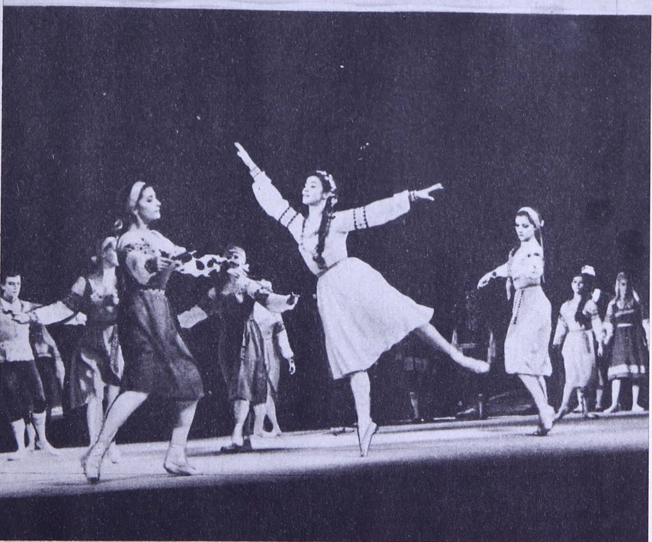
Республиканской музыкальной театрсa коллектив выльысь сувтöдiс «Яг морт» балет. Музыкаыс Я. Перепелицалöн.