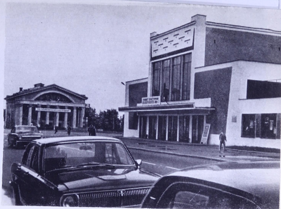
Финской драматической театр. Тані торжествен- ной востисны Карелияын Коми республикалөн куль- тура да искусство луньяс.