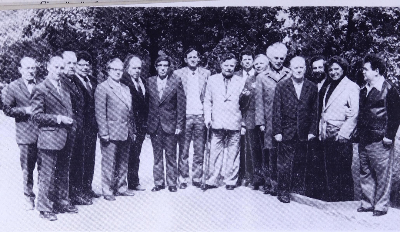
Карелияса да коми гижысьяс.