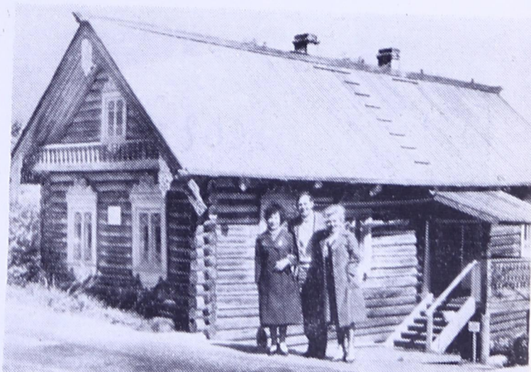
Карелия деревняса керка дорын.