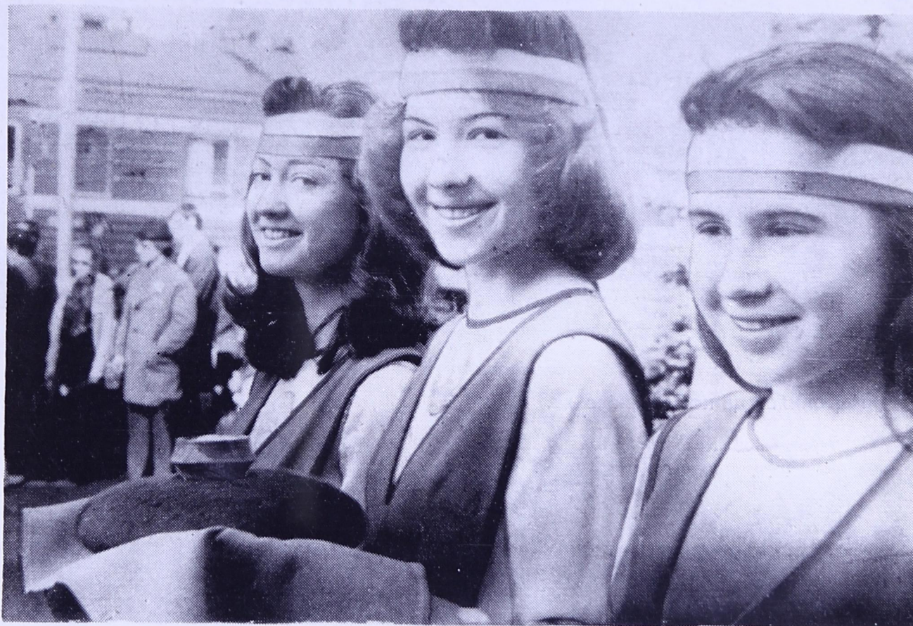
Национальнӧй паськӧма нывӧяс локтисны Комиысь гӧстьяс динӧ няньӧн-солӧн.