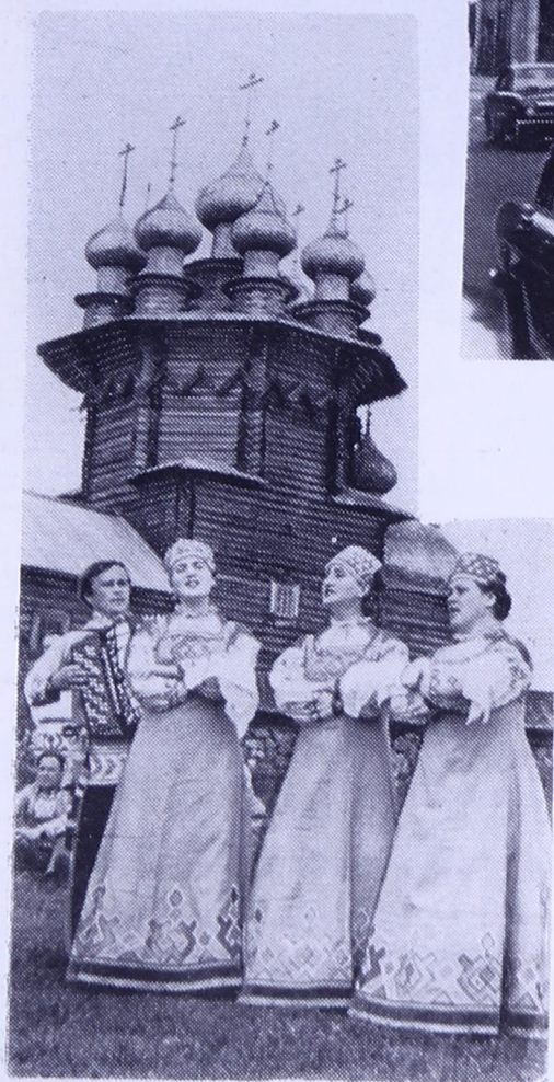
Ижмаса сьылысьяс Кижі ді вылын.