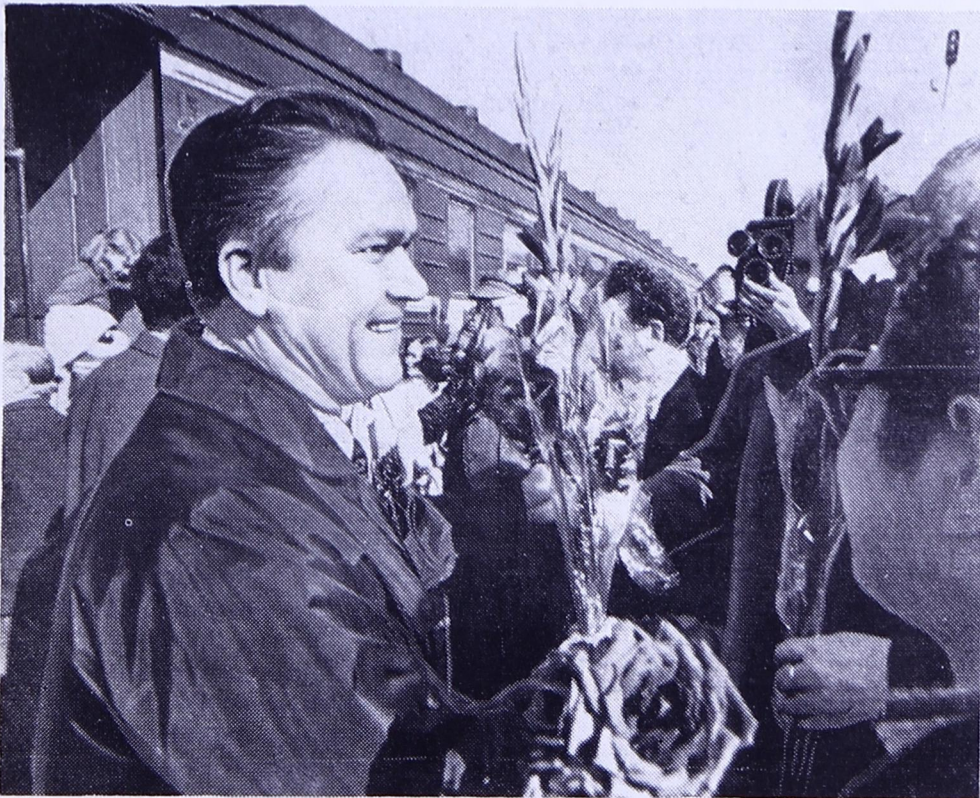
Дзоридзьяс, пӧся ки кутлӧмьяс...