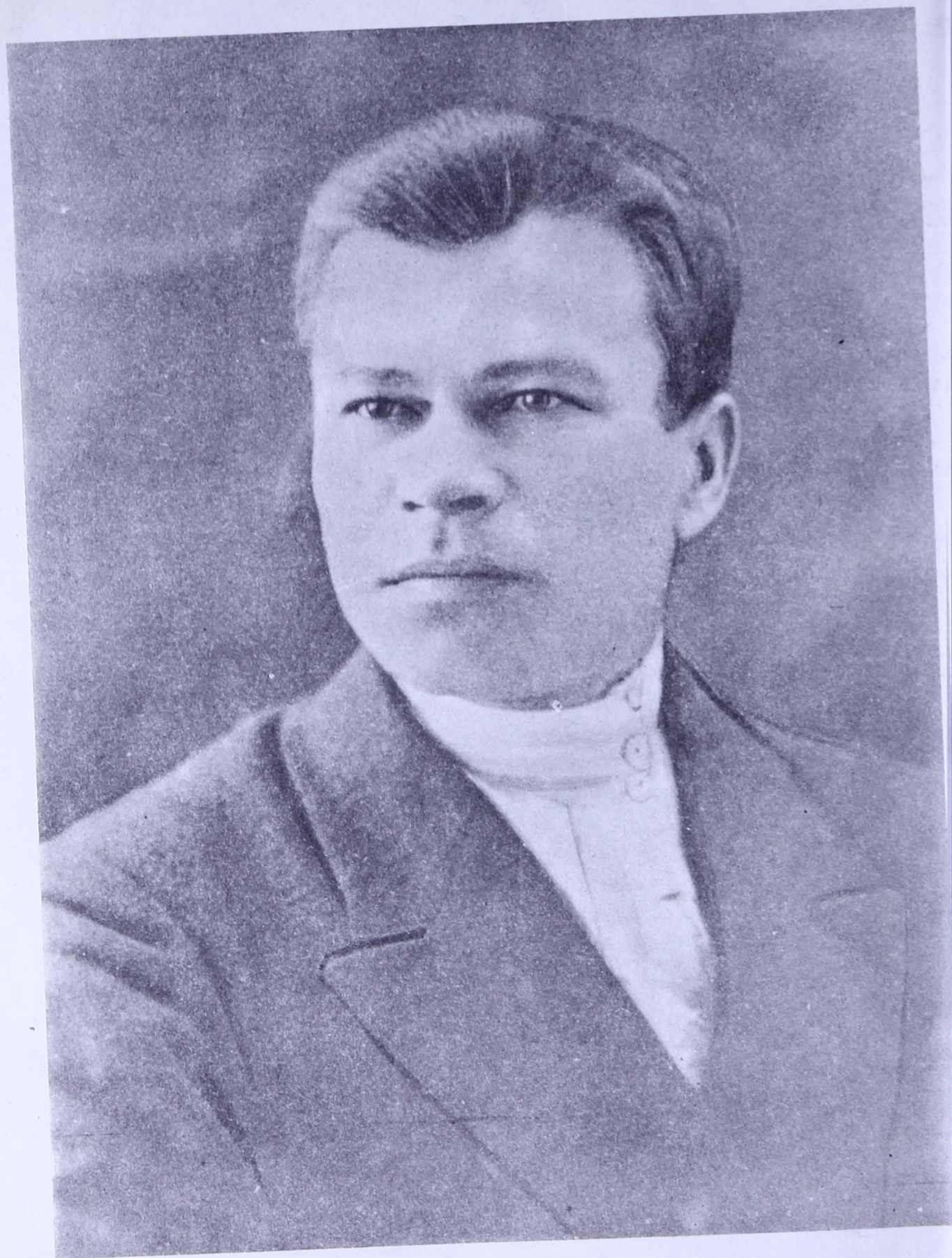
Небдінса Виттор. 1918 во.