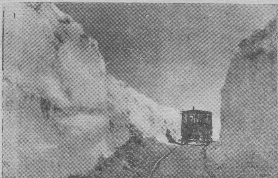
Снимок вылын: Хальмер ю районё көрттуй, кодэ мувё лым гёраяс костті.