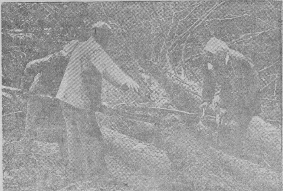
Снимок вылын: Электропилаби вöчöны вөр.