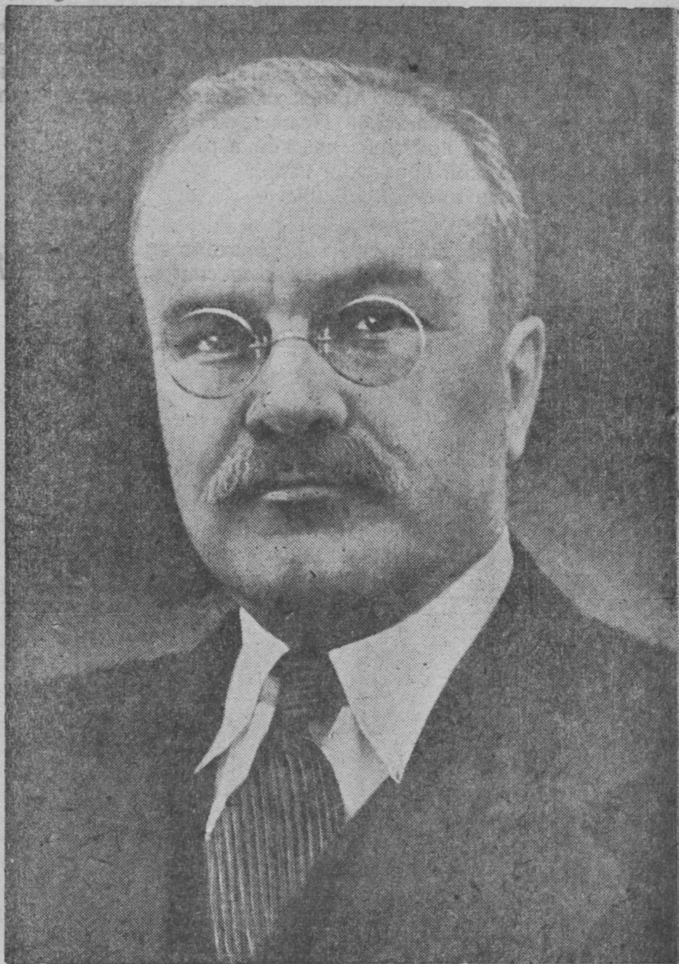
ВЯЧЕСЛАВ МИХАЙЛОВИЧ МОЛОТОВ