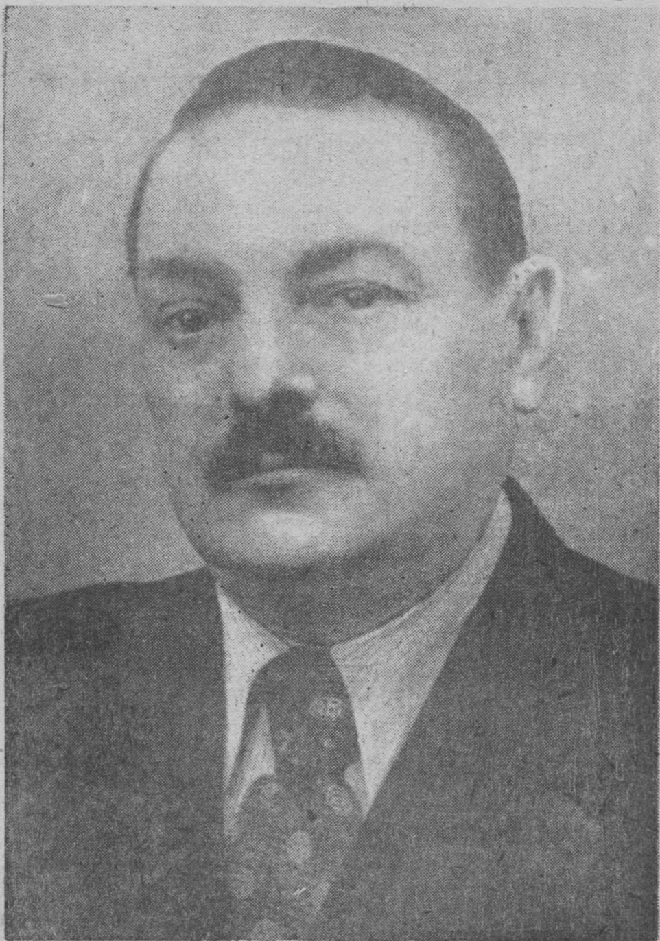
АНДРЕЙ АЛЕКСАНДРОВИЧ ЖДАНОВ