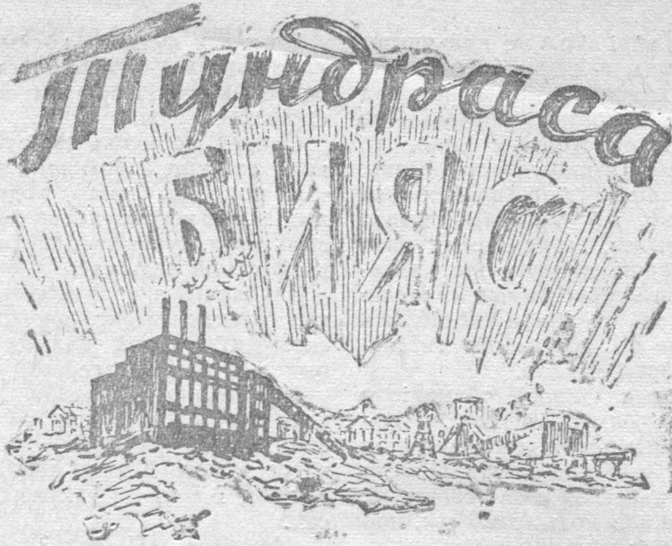
Рисунок худ. В. ПОЛЯКОВЛОН