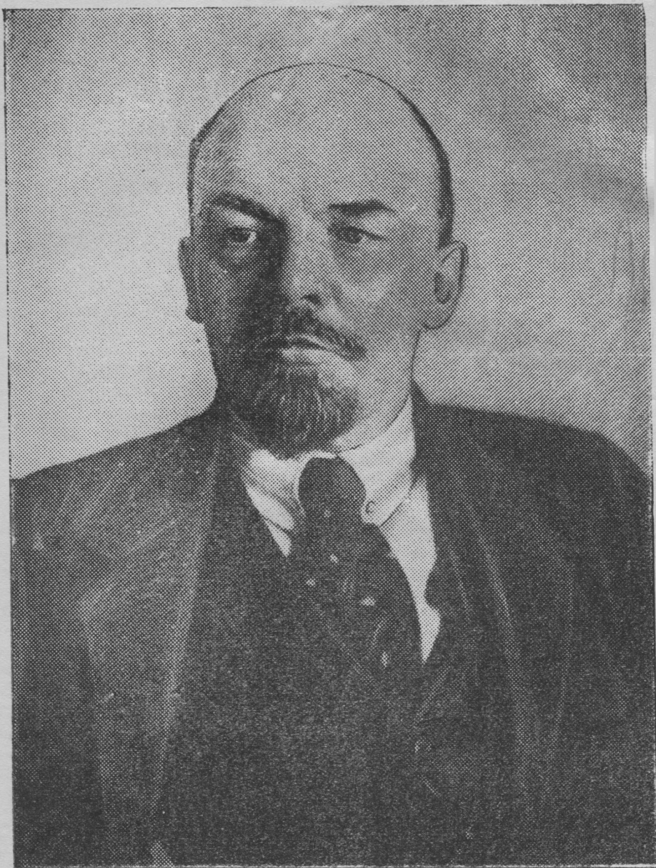
ВЛАДИМИР ИЛЬИЧ ЛЕНИН