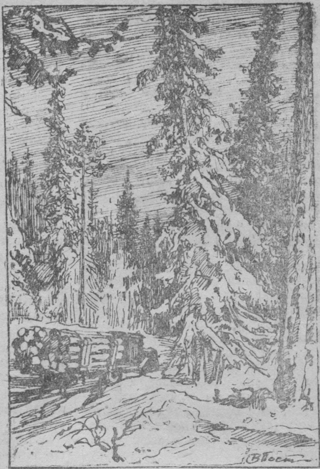
Машывайн кыскöны вöр.

— Эг вермы терпитны, татшöм мяча поводдя и друг машина кутас сулавны,—висьталiс сийö водзö, да быттьö тайөн кöсйис подулавны ассьыс татчö немвиччысьтöг воимсö.