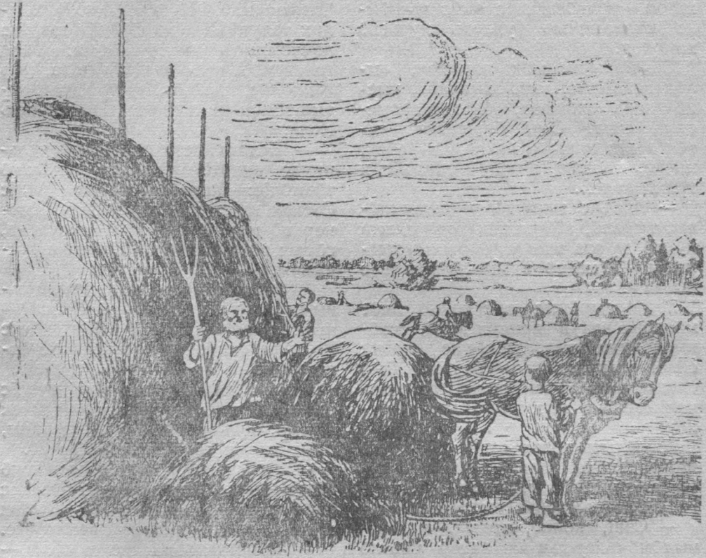
Пуӧмӧн пуӧ ӧтувья удж.

Паськыд отӧн исковтӧ Эжва, петӧ чукуль сайсянь, бытӧ чужӧ му увсыс; увланыӧ, неылӧ, сійӧ бӧр дзебсьӧ вӧра нырд сайӧ. Отарын и мӧдарын пом—позьӧ чайтны, мый тайӧ абу помтӧм кузь Эжва ю, а кузьмӧс чукля ты. Тайӧ чукуляс джуджыд йир. Буждӧдӧм берегыс мегырӧн дорӧсалӧ йирсӧ, артмӧма ыджыд кӧдж. Кӧдж пӧ-