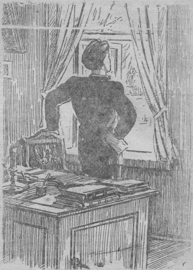
Куратов восьтѳс ѳшиньсѳ да дыр видзѳдѳс узьысь кар вылѳ.

Мый тайѳ—случайность али нарѳшнѳ лѳсьѳѳм наказание? Епар-