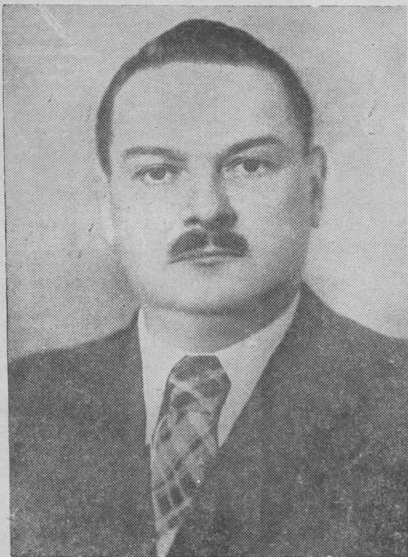
АНДРЕЙ АЛЕКСАНДРОВИЧ ЖДАНОВ