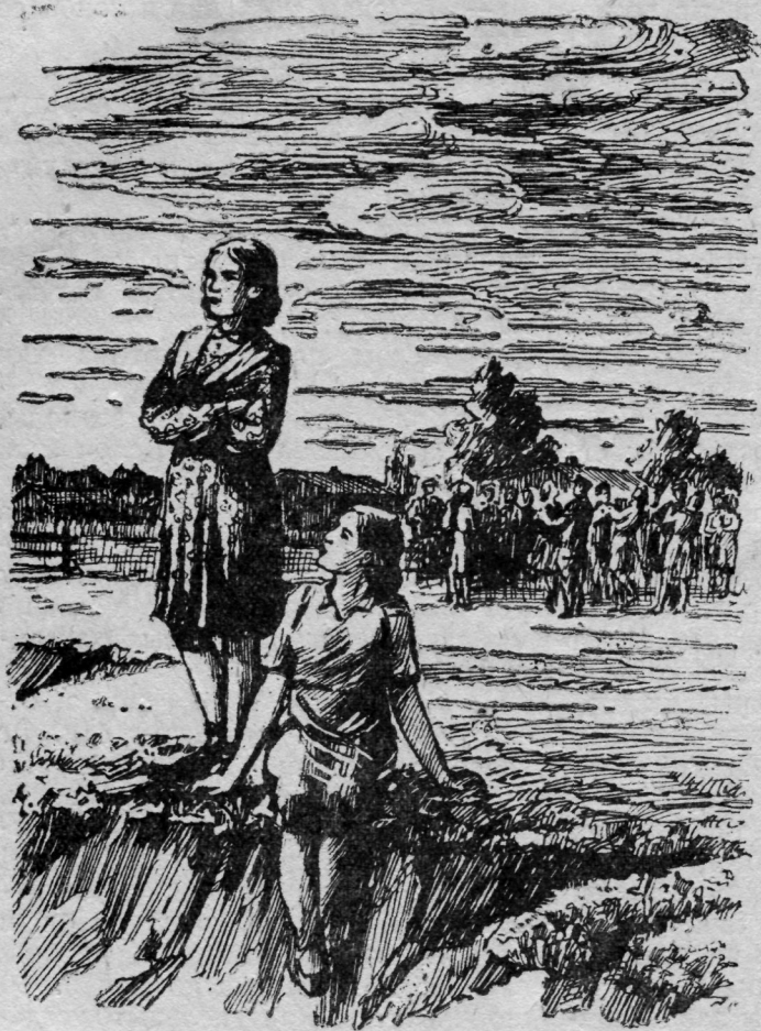
Агнюша пуксис дзик бужёд дорас.

быдсон вежыньтіс чужомсё. — Ме ачым петкода йёзсё!