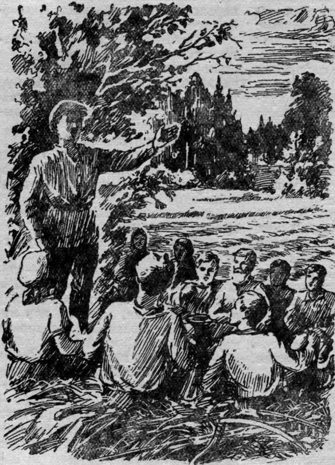
Лбсьыд вблі видзодны Михаил выло, кор сйб тадзи йбз водзын сбрнитліс.

— Танечка, позволь, тэныд колд шойчыштны, — заводитліс протест- гуйтны Петрович.