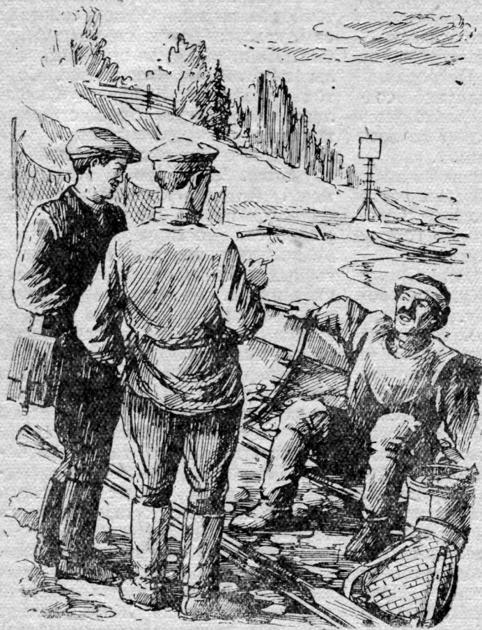
Сійб тешкодя ляпмуні пуксис пыж пыдбсса ваас, черняссб аснас сайбдны зилиг.

ны немторйысь нин влі. Гбтыр син восьтыны оз лэдз. Быть лон вбчлыны оти рейс Койтыбдз природанас любуйтчигмоз. Оз-б коть, мися, кокысь юкалбмыс прбйдит.