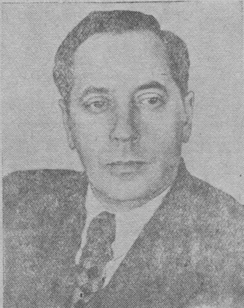
Г. И. ОСИПОВ.