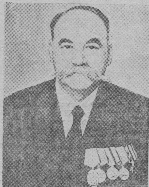
М. В. КУЗЬМИН.