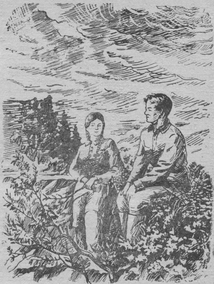
Ондрейлөн чужөмыс друг лоис ласковджык.

лы бара эз мөд сюрны, мый йылысь сёрнитны. Сэк жө полуглиссер пет- көдчис нин ю чукылысь да, васө паськыда поткөдөмөн, өдий матыст- чис; мөдісны нин тыдавын сэн пука- лысьяс.