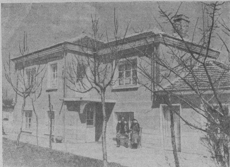
Болгарияса сиктын ТКЗХ-са членлөн виль керка.

Куш гора йылысь аддзим крест. Зэв вылын сийо, муртса тыдало. Коди сийос лэптис?