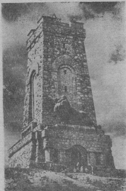
Шипка гӱра вильн роч воинъяслы памятник.

Варна вокзалын пырим вагонъясӱ, мӱдӱдчим гортӱ. Тӱрыба мунӱ поезд, кытшлалӱ гӱраяс боктӱ, вуджӱ веж долинаяс, кольбны сиктъяс да каръяс. Виль Болгарияса йӱз быдлаын сетӱны ассьыныс став вын шуда, свободнӱй олӱм стрӱйтӱм вилӱ.