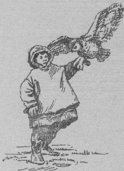
Рисунок худ. П. Митюшевлён