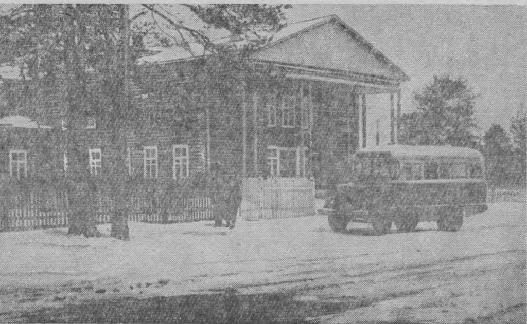
Помōсдин сиктын выль Культура керка.

«Вужнас, вужнас колō гудйышт-ны тайō пез позсō!»—мунігмозыс гораа вашкōдис старик.