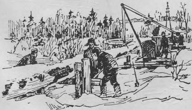
Вой-Вожын перйоны газ.