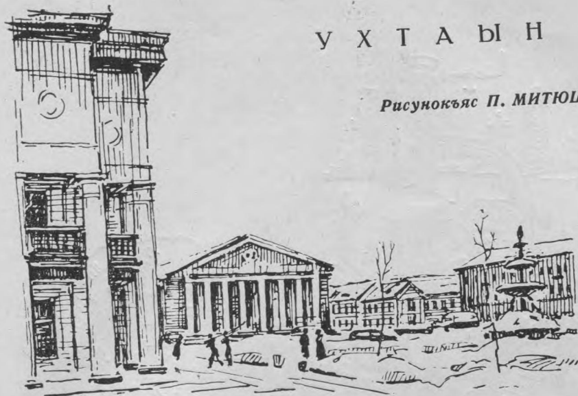
Ухта кар. Мир нима площадь.