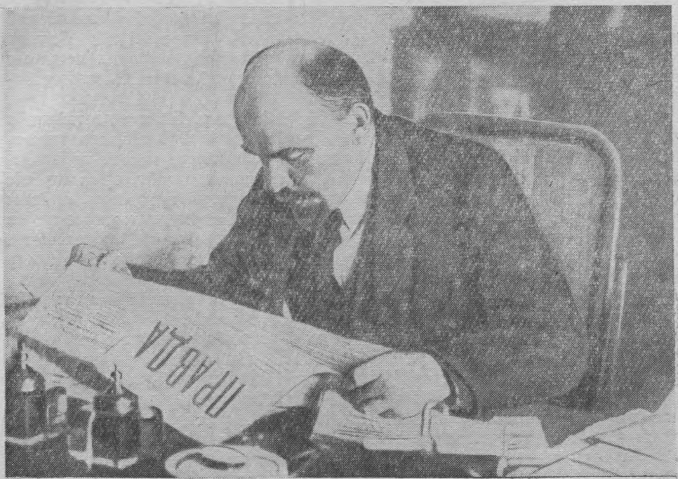
В. И. Ленин аслас уджалан кабинетын