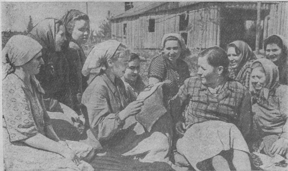
Удж костын (Сыктывдинса райпромкомбинат)

Ыб увсянь котөртись төвру визьлөдліс Тонялысь пушкыра юрсө, окаліс чужөмсө, кутліс тушасө, весиг лолыштны лолі ськыд.