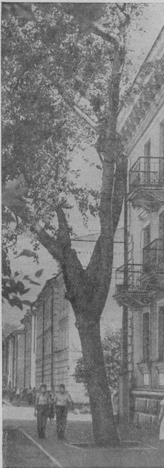
Сыктывкар. Орджоникидзе нима у

Дзик на неважӧн Сыктывкарлӧн вӧли нач ӧти «ворота» — карӧ позис локны сӧмын Эжва да Сыктыв юяс кузя, но, дерт, и вӧла туйясти, «ямӧн». Ӧни Сыктывкар йитчӧма Москвакӧд, Ленинградкӧд да уна мукӧдгырысь карьяскӧд, а сӧдз жӧ республикаса став районьяскӧд самолӧтъясӧн. Пыр водзӧ Княжпогостлань, Койгородоклань, Усть-Куломлань и Леткалань нюжалӧны бур шоссеинӧй туйяс, уна сиктъясӧ нин ветлӧныгырысь автобусьяс. Но республикаса уджалысь йӧслӧн медся ыджыд радлуныс сын, мый Коми автономиялы 40 во тырӧм водзвылын Сыктывкарӧ воис первой поезд. Кӧрт туй, код йылысь сӧрнитлисны Советской властлӧн первой воясӧ на, стрӧитӧма, и абу нин ылын сийӧ кадыс, кор Сыктывкар станцияӧ сувтасны вагоньяс, кодъяслӧн бокъ-