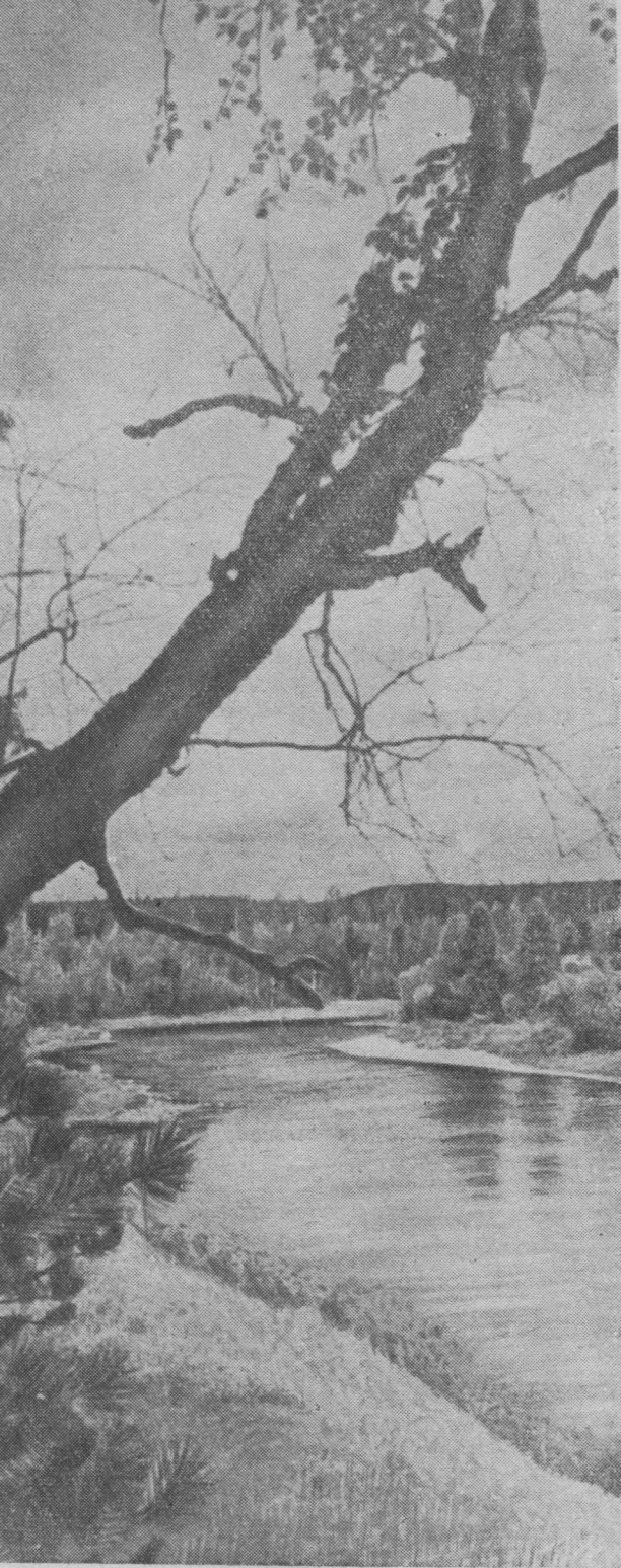
Неылын Сабля гӱрасянь. А танӱд орчӱн сылытӱм йи.

яс мича луӱ пӱзӱ ад- дзыны Инта карсянь.