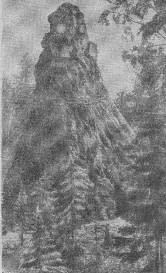
Төв да ва вöчисны та ыджда уджсö. Печора йылын известняковöй скала Ош

Қожим ю бердын Урал паськалө 100 километрöдз, некымын горнöй хребет куйлöны орччөн рытиввывсыань лунвылө визьөн. Тайö хребетьясыс — Обе, Салоды, Малды, Россомаха, Исследовательскöй, Народоитынскойöй. Обе да Салоды хребеть-