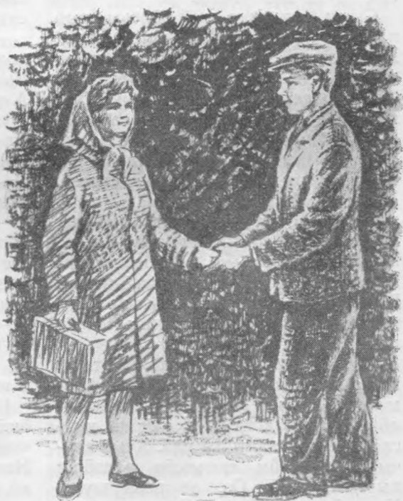
«Топыда кутліс Вералысь кисѓ».