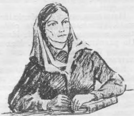
«Наста пукаліс ѓтнас».