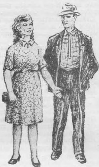
«Вера муніс тѓдтѓм зонкѓд».