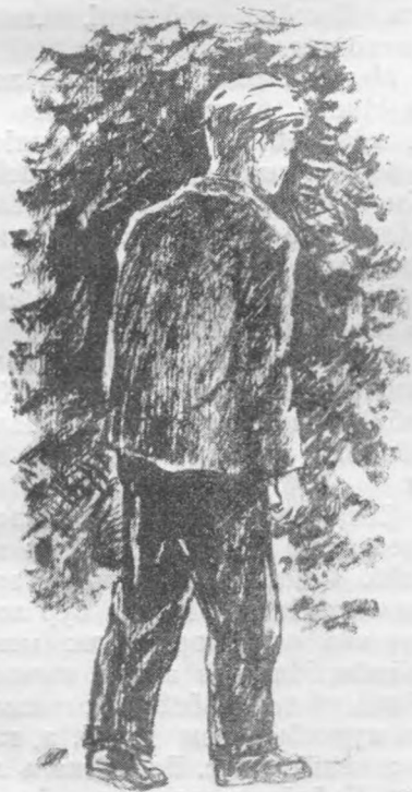
«Ильялы вѓлі гажтѓм».