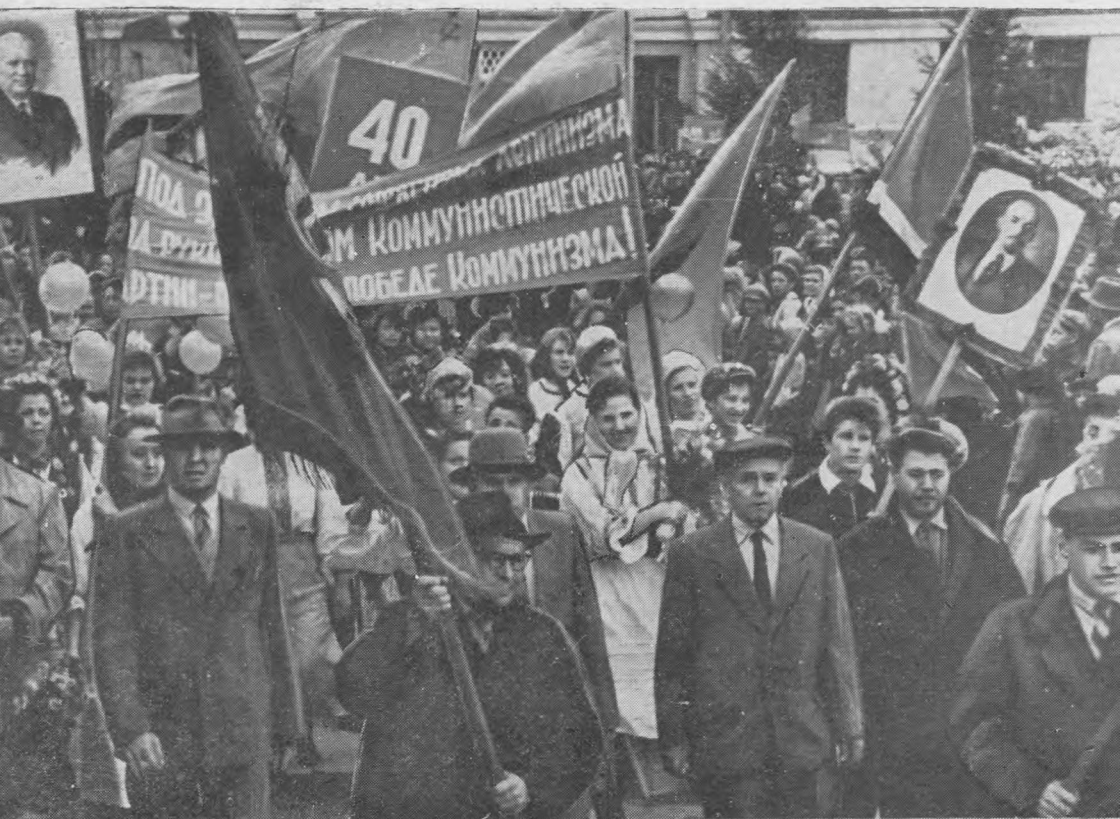
Юбилейной площади вылын митинг.