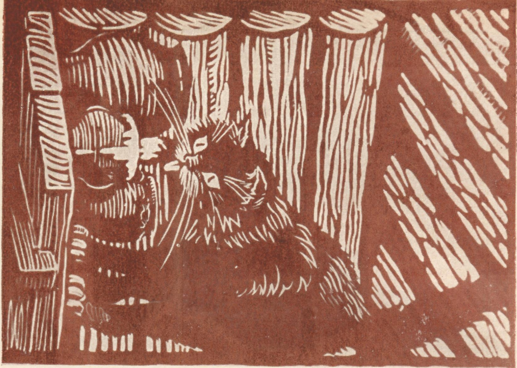
▼ М. Безносков, ПОВТОМ ВАСЬКА