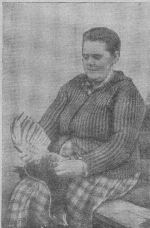
Федора Алексеевнаны Тоня нылыс ыстөма гөснеч.

Прөйдитчим сикт кузя. Во кык сайын пö танi вөли кызы кымын керка, а өнi—42. Унджыкыс мича выль стрөйба. Эм школа, конi велөдчөны 32 нывка да детинка. Эм магазин, промыслөвой овмөслөн контора да с. в. Артмөны нин мичаник уличаяс. Колө чайтны, коркө танi лоас ыджыд сикт, а сөсся, гашкө, кар: Печорской море стрөитгөн пö став уліджык сиктыясыс олысыяссө катөдасны татчө.