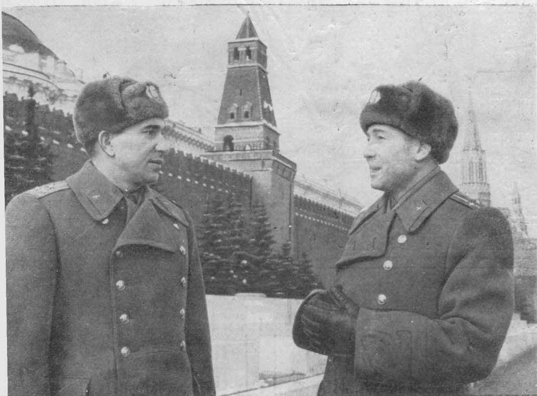
Павел Бељев да Алексей Леонов космосо лэбзьом водзвылын.