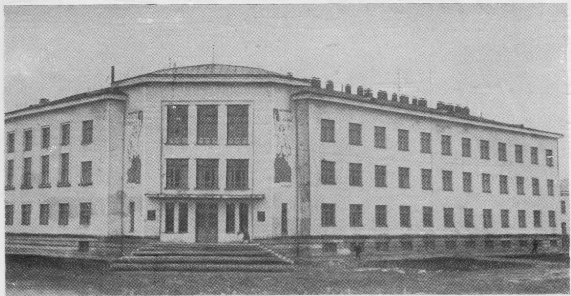
СССР-са наукаяс Академиялөн Коми филиал. Виль лабораторнй корпус. Июнь 25—30-öd луньясö тані кутас мунны финно-угроведение кузя Ставсоюзса конференция.