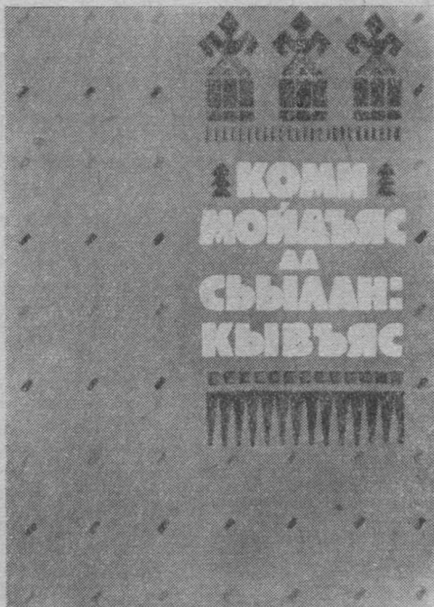
«Коми мойдъяс да сьыланкывъяс» книгалӧн обложка.

А вот «Висер вожа сьыланкывъяс да мойдъяс» книгаын текстыслӧн народно-поэтической образностыс бура да эскана тыдалӧ художественной оформлениысыс. Пемыд-веж коленкорӧвӧй переплӧт вылын — куйлысь да горӧдысь йӧралӧн силуэт. Форзац вылын — вышивайтӧм чышъян, кодӧс вӧчӧма народной орнамент стильӧн. Ташӧм жӧ манерабн рисуйтӧма мойдса вӧлӧс «Мойдъяс» юкӧнлӧн шмуцтитул вылӧ. Ставыс тайӧ лыддысьсысьс вайӧдӧ народной сказаниеяслӧн поэтической мирӧ. «Коми народной мойдъяс» книга оформитӧгӧн переплӧтас да титулас удачной используй-