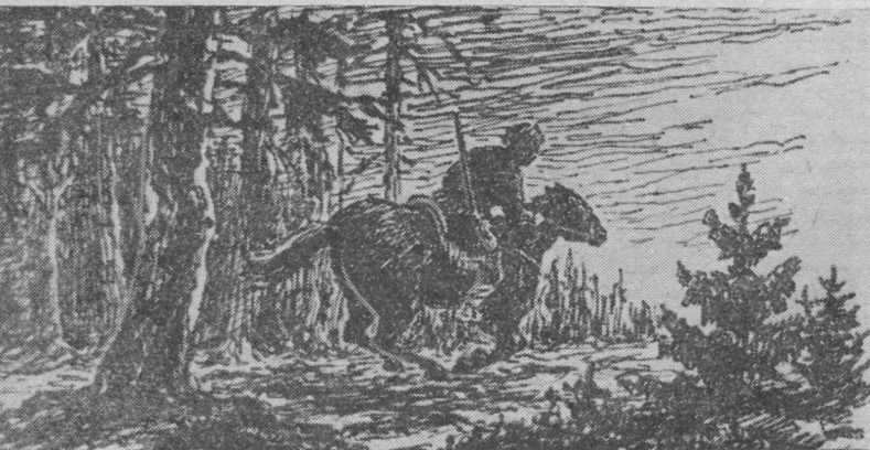
А. Фадеевлөн «Метелица» книгагас рисунк.