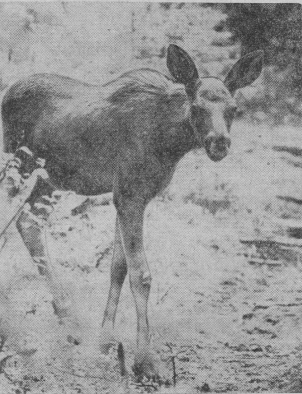
АРСЯ ВӨРЫН АСЫВ

Та бөрын вөралысьяс пиысь не-код нин эз ойбыртлы. Көть эг йөра кыйны локтөй, а ун воши. Оз өд татшөмторйыд быд лун овлы.