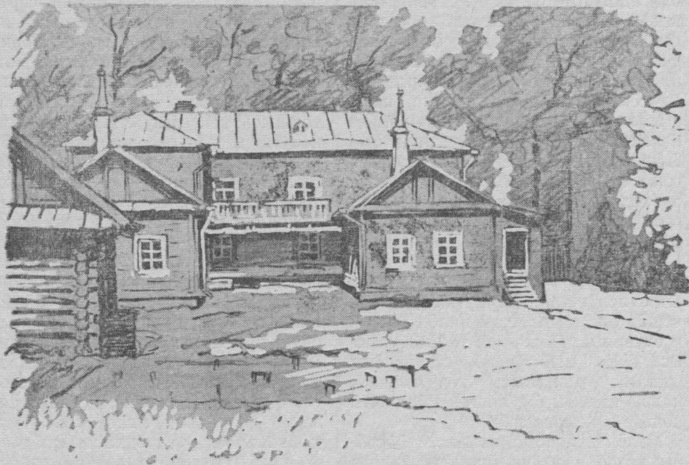
Ульяновск карын музей-керка, кöни челядь дырйи бать-мамыскöд да чой-вокъяскöд овлис В. И. Ленин.

Ленинскöй томьясыс аддзан гижöд, кöни Владимир Ильич пасйö, мый бур эськö вöли гожöмнас ветлыны Волга вылö, мый сйö гажтöмчис Волгаысь. Россия сетис мирлы великöй Ленинöс. Симбирскын (öния Ульяновск) Володя Ульяновлөн кольö челядь-дырся да том кадыс. Волга вылын том Ленин тöдмасьö марксистскöй книгаясөн, заводитö нудны революционнöй удж. И гөгөрвоана, подпольеын, ссылкын, рөдвужыслы письмөясын В. И. Ленин казтылö Волга йылысь. Тайö ыджыд ю вылас чужлысны стра-