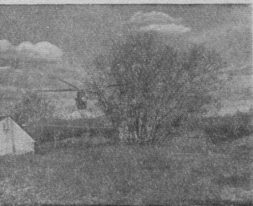
Геофизикъяслiн гожся базаö воис вертолёт.

— Ми сöмын на, вёсқыда кö шуны, заводитім колана ногөн корсьны войвывлысь озырлунъяс-сö,— мөвпалігмозыс шуис Илья Исаевич да бергöдчис миянлань.—