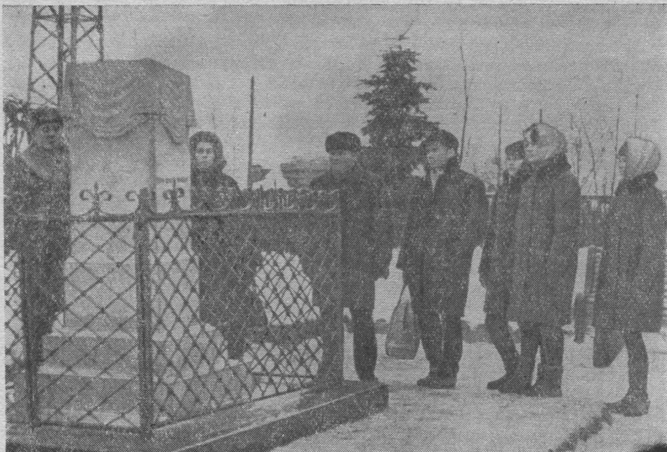
Ми И. Н. Ульянов гу вылынөсь.

Ичөтысянныс Володя Ульянов сюся кутіс видзөдны олөм вылас да гөгөрвоны, мый вөсна сьөкыда олө уджалысь морт. Но сійөс мездөм