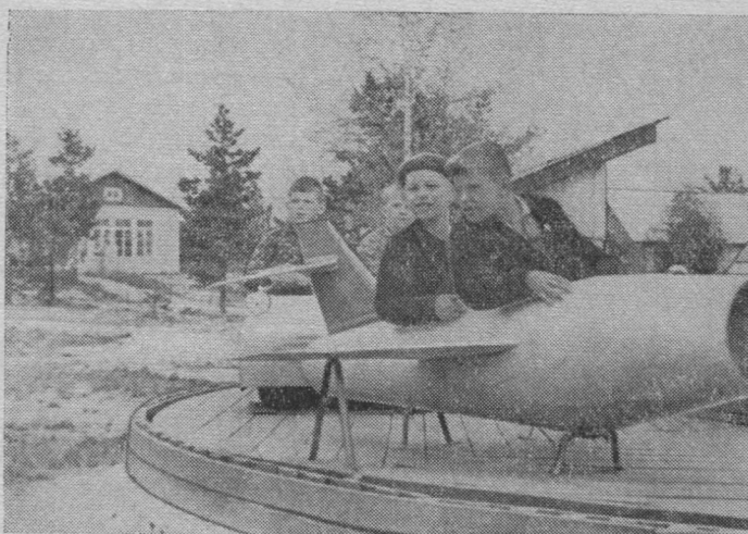
И РАЦИЯҮД ЭМ ЧЕЛЯДЬЛӨН. ӨД КОЛӨ КУТНЫ ТОПЫД ИЙТӨД ӨТИ ОТЯДЛЫ МӨДКӨД.