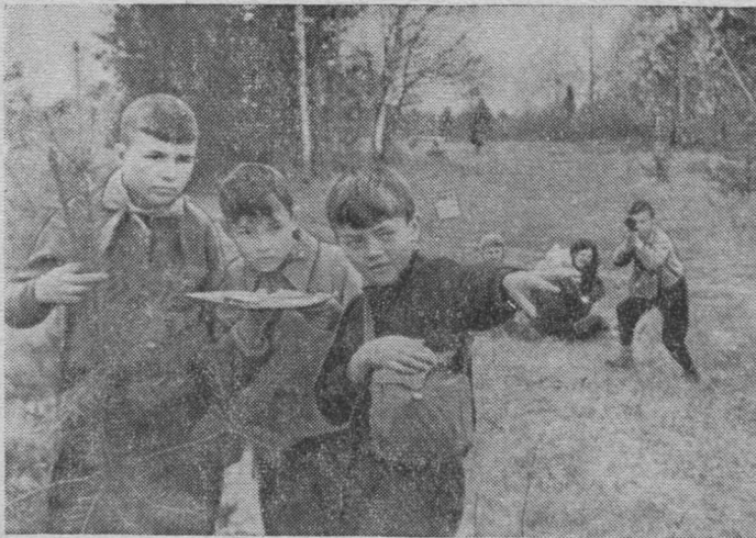
ТАЙОС ПИСЬКОДӨНҮ ВОДЗӨ МУНАН ТУЙ.