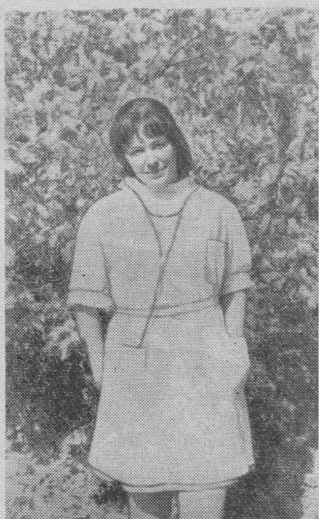
Н. Гущина лечитб сиктса йбббс.