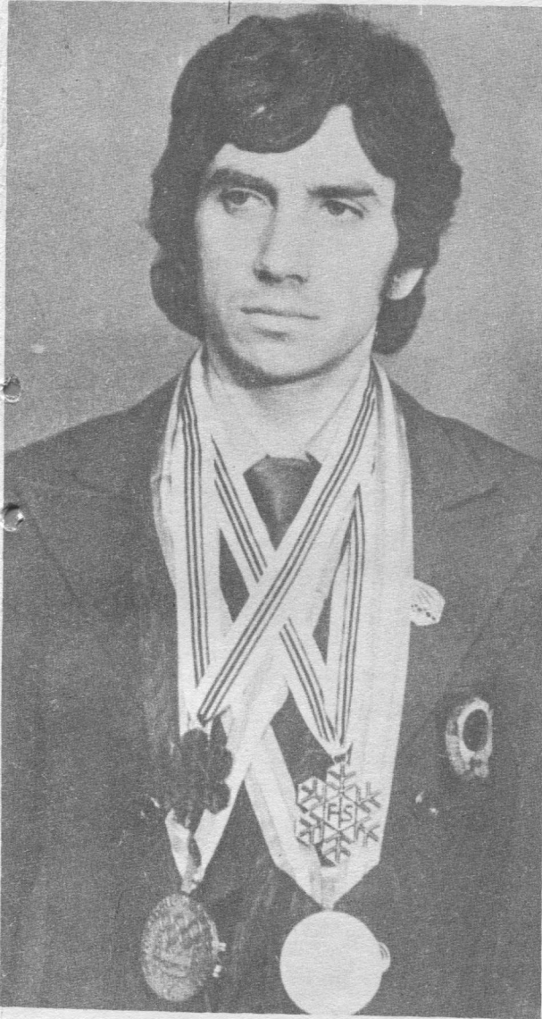
XII төвсә Олимпийскöй чемпион, СССР-са спорт кузя заслуженнöй мастер Николай Бажуков.