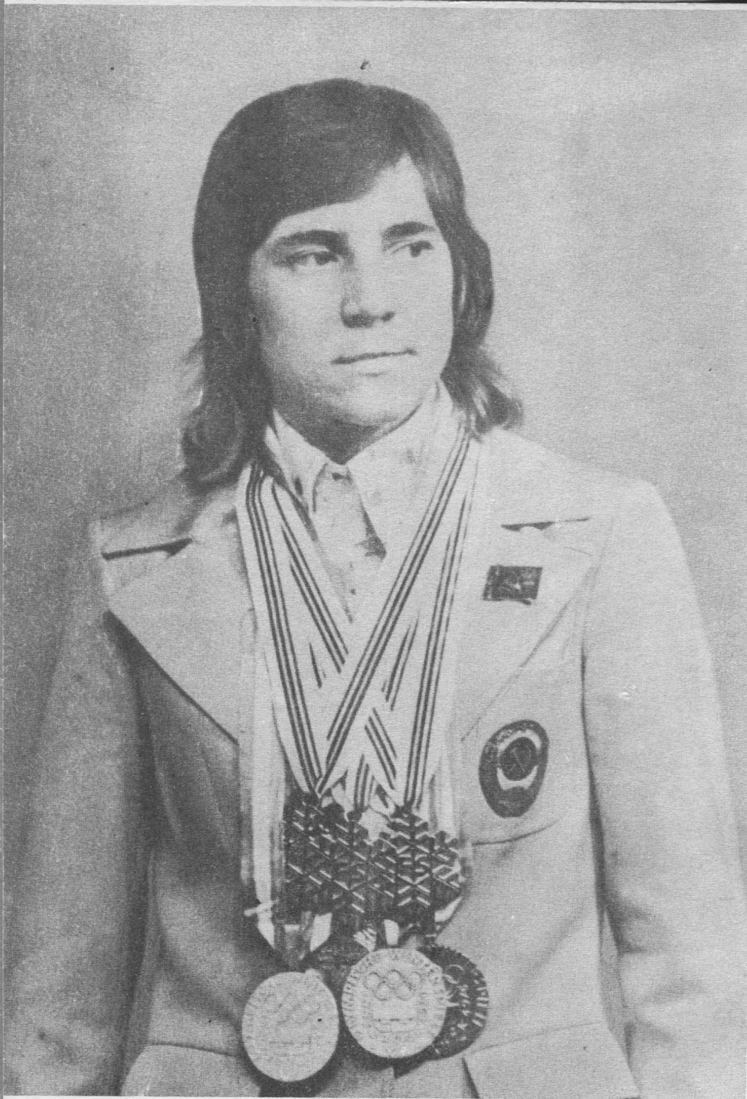
XII төвсә Олимпийскöй чемпионка, СССР-са спорт кузяс заслуженной мастер Раиса Сметанина.