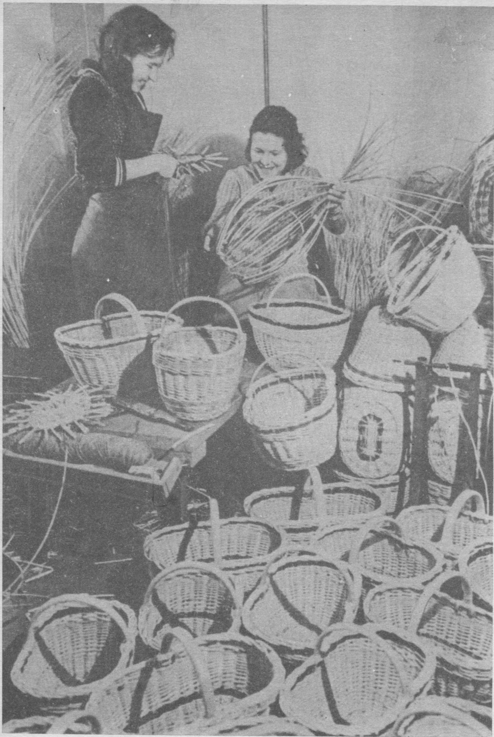
Визин лесопунктса нывъяс.