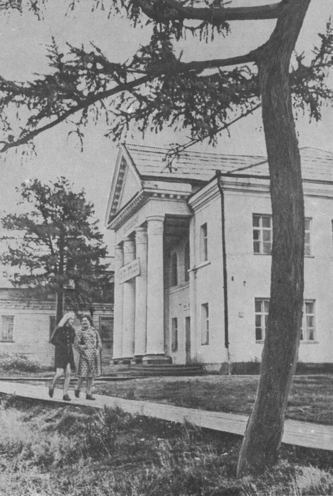
Усть-Цильмаын Культура керка.