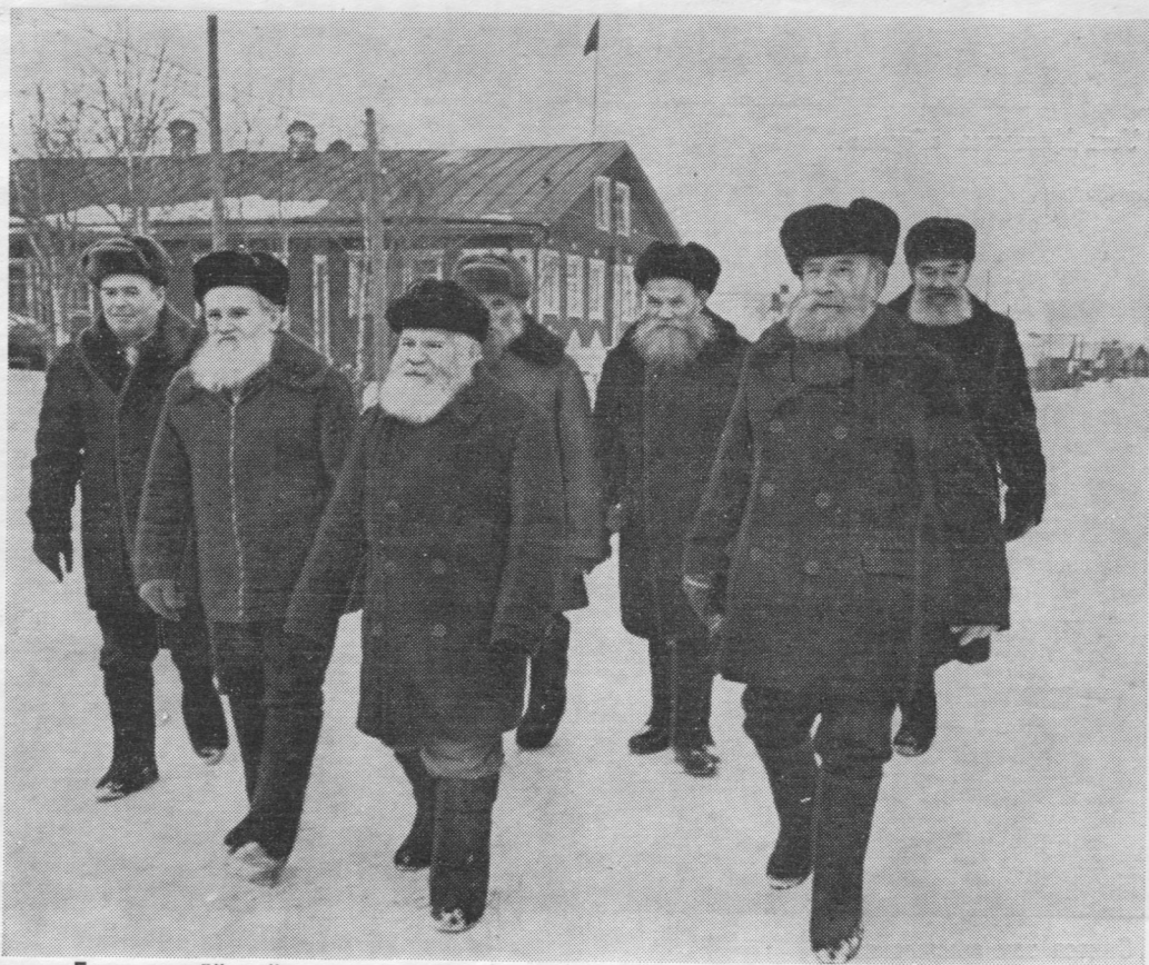
Граждансöй войнаса ветеранъяс.