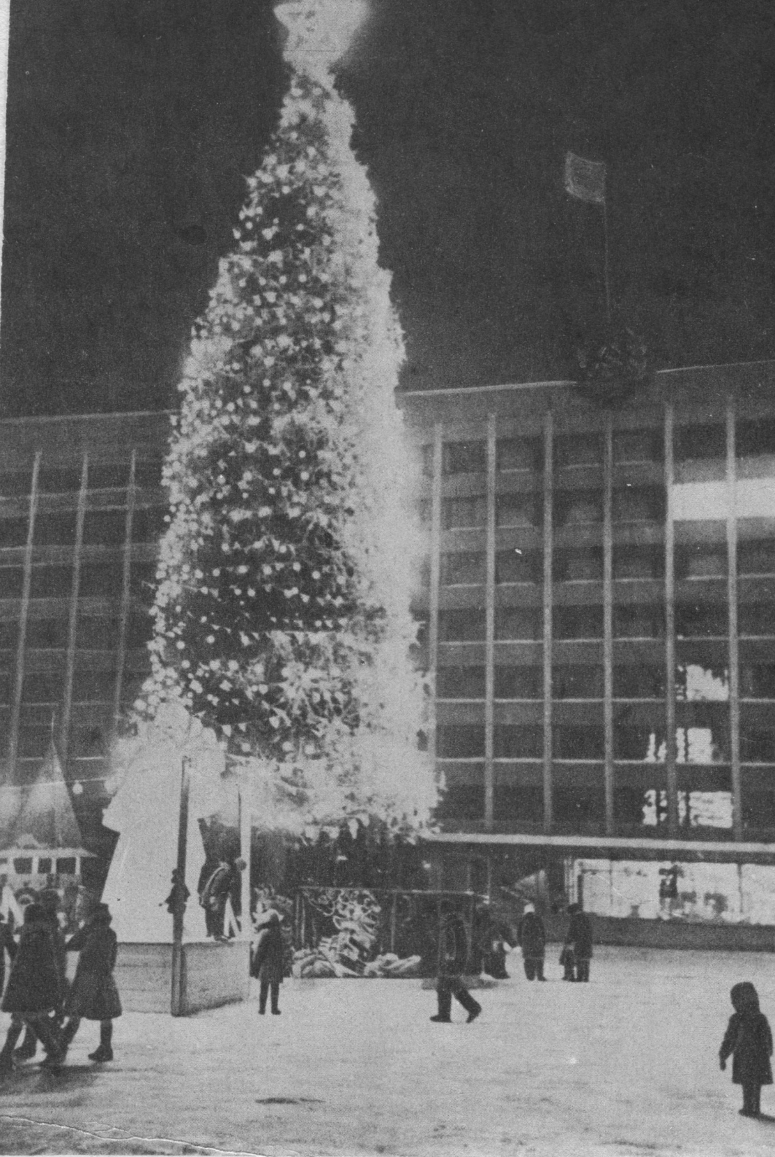
Сыктывкарын Вэль вося ёлка.