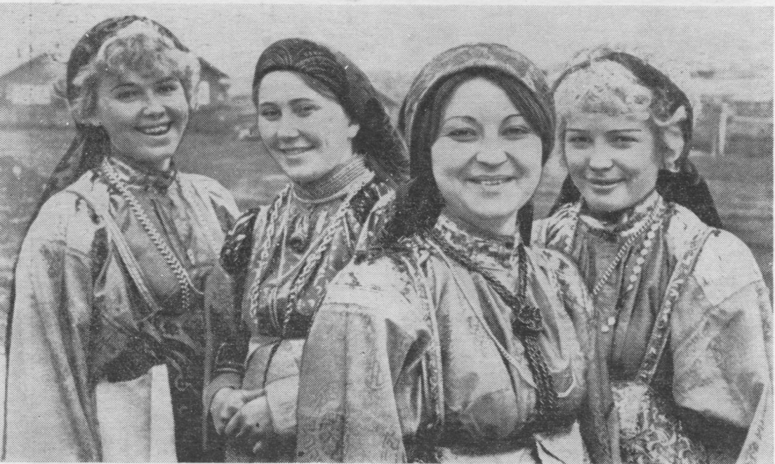
Сиктса том сьылысьяс.