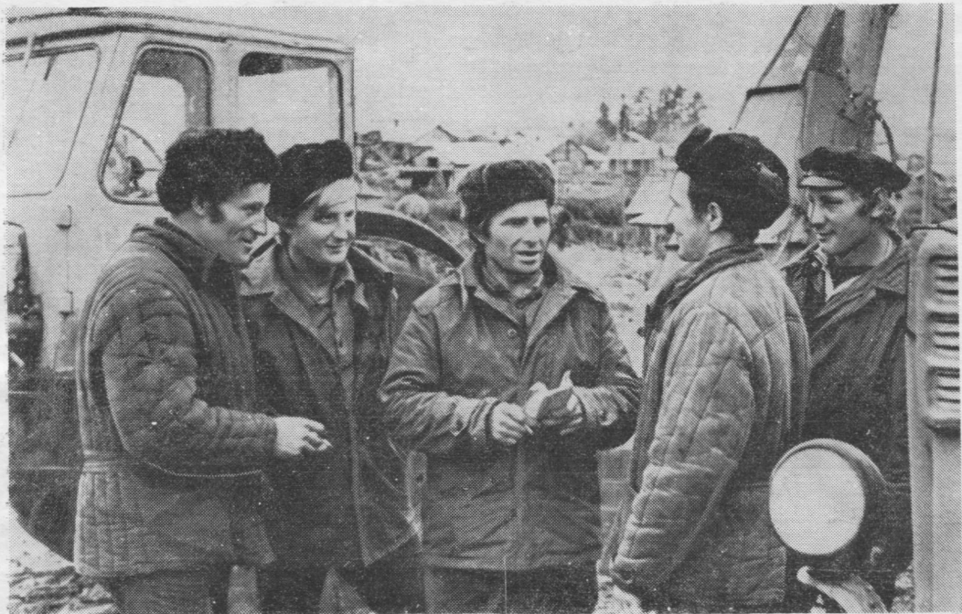
Бур уджён нималёны татчёс механизаторьяс.