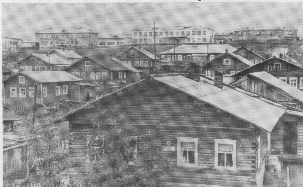
Паськыд Печора пöлөн пунсьöма Усть-Цильма сикт.