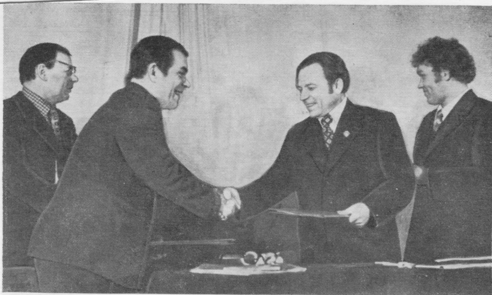
Уна йӧз волісны рытнас культура Керкаб. Тани сиктса уджалысьяс да коми гижысьяс кырымалісны творческой йитӧдъяс йылысь договор.