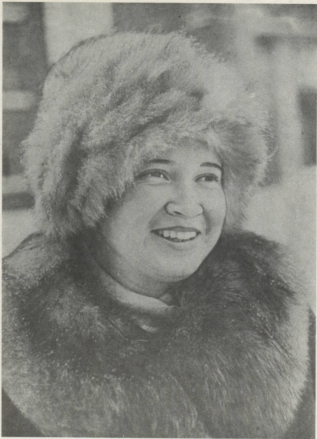
«Сыктывкарстрой» трестысь том йӧз бригадаӧн веськӧдлысь Е. К. Туркина — СССР Верховнӧй Сӧветса депутат.